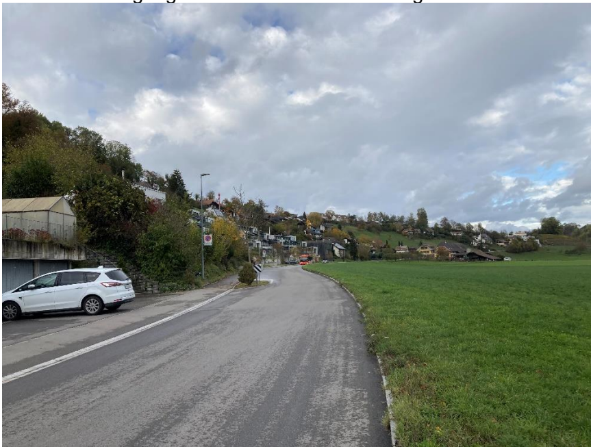
Einseitige Strassenverengung auf der Aeschelbrunnmattstrasse, Foto vom 10.11.2023

Der Strassenabschnitt auf Gemeindegebiet Zollikofen ist ca. 350 Meter lang, dann wird die Strasse zur Aeschelbrunnmattstrasse auf Gemeindegebiet Bremgarten. Auch hier ist Tempo 50 signalisiert, einseitig hat es kurz nach der Ortstafel hangseitig (Nord-West) ein Trottoir und durch einseitige Strassenverengungen wird der Verkehr verlangsamt.