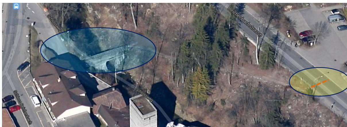
Übersicht mit Fussgängerbrücke und Strassenquerung Reichenbachstrasse

Die geplante Sanierung enthält Massnahmen zur Erhöhung der Sicherheit mittels Stabilisierung der Brüstung, und die Sicherung der Bausubstanz um einer "Verlotterung" des unter Denkmalschutz stehenden Brückenkörpers entgegenzuwirken. Zudem sollen neue Rohrumhüllungen die an der Brücke angebrachten Werkleitungen schützen.