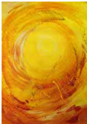
Acryl auf Leinwand, 75 x 52 cm

1970* in Wien. 2004 Akademie der Bildenden Künste Wien (Malerei) – kontinuierliche Ausstellungstätigkeit seit 1997, darunter 2000 Galerie Haus der Begegnung, Eisenstadt. 2002 Schloss Kittsee. 2002 NÖ Dokumentationszentrum für moderne Kunst, St Pölten. 2004 University of Kent-Centerbury (GB). 2005 Galerie Schinner, Mattersburg. 2006 Blau-Gelbe-Viertelsgalerie, Bad Fischau. 2008 Kulturhaus Győr (HU). 2008 Schloss Lackenbach. 2009 Artbox Kulturzentrum Mattersburg. 2011 Zollikofen, Schweiz. 2011 Galerie Arpege, Sarreguemines (FR). 2012 Margret Bilder Galerie, Schlierbach. Gestaltung der Kirchenfenster der Pfarrkirchen Neudörfel und Frankenau 2007 und 2008 sowie der Gemeinschaft Cenacolo in Kleinfrauenhaid, hält laufend Kunstkurse.