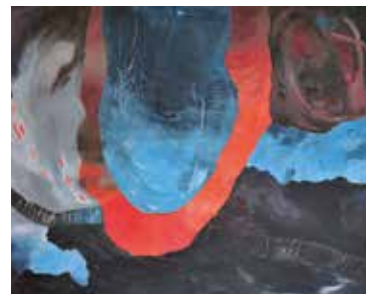
Ohne Titel, Oel auf Leinwand, 80 x 100 cm

«Ich bringe meine Geschichten, meine inneren Bilder auf Leinwand. Durch Farbe und Form nehmen die Erlebnisse wieder Gestalt an.