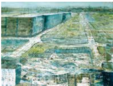
Grossstadt, Aquarell, 57 x 76 cm

Als malbegeistertes Kind wusste ich noch nicht, dass das «Bilder-Machen» einem Bauchweh, Krisen bereiten, oder Flügel verleihen kann.