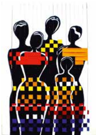
«Kunst und Werk», Acryl auf Leinen, Webart, 100 x 70 cm

1946* in Neudörf. 1990 erste Ausstellungsbeteiligung in Österreich, seither laufende Ausstellungstätigkeit – darunter: 1999 Stadterneuerung Favoriten (Wien). 2001 Artbox, Kulturzentrum Mattersburg. 2006 Kurhaus Bad Sauerbrunn. 2007 Schloss Margarethen am Moos, Niederösterreich. 2011 Inforama Rütli, Schweiz. Bietet seit vielen Jahren Handarbeitskurse für Erwachsene, erstellt Handarbeitsanleitungen für Verlage, leidenschaftliche Theaterspielerin und Chorsängerin.