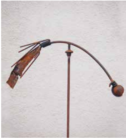
Windflügel, Eisen, L95 x B10 x H40 cm

Ernst Jordi bleibt beschwingt oder beflügelt und bringt Eisen nach wie vor zum Tanzen. Das Spannungsfeld von Gegensätzen, von Schwere und Leichtigkeit, ist seine Herausforderung, um mit Dynamik und statischer Ästhetik eigene Kreationen zu gestalten.