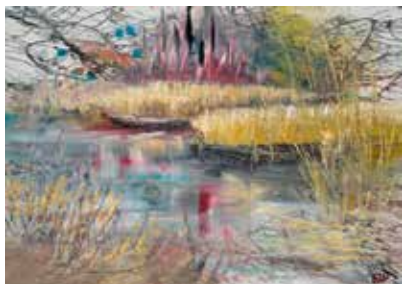
«Idylle am Neusiedlersee», Acryl und Oel auf Leinwand, 50 x 70 cm

1940* in Neudörfel. Autodidaktin. Ausstellungstätigkeit seit 2000, darunter Einzelausstellung 2002 Wienerturm Bruck a.d. Leitha. 2003 Schloss Bad Fischau. 2004 internationaler Kunstaustausch Sopran, Ungarn. 2005 Fest der 1000 Bilder im Schloss Krastowitz, Kärnten. 2006 Cafe Doblhoffpark Baden. 2007 Margarethen am Moos. 2009 Haydn Ausstellung in der Kulturfabrik Hainburg und im Schloss Kobersdorf. 2011 «Liszt» in seinem Geburtshaus in Raiding, seit 2007 Malen von Ikonen sowie seit 2010 Anfertigung von Designerschmuck.