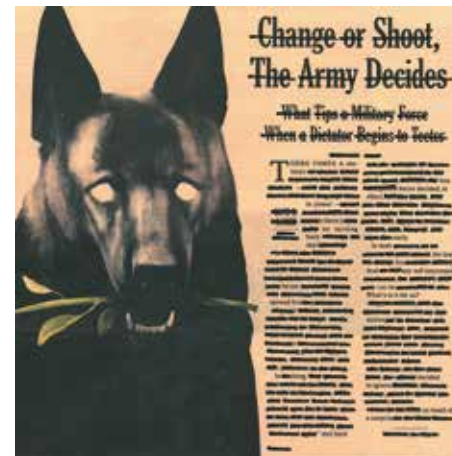
«Das obszöne Werk» (Ausschnitt), Installation aus unterschiedlichen Objekten