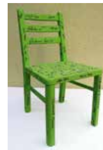
Part of Installation «Sitzplätze Europas», «Besuchersessel 2012», publikumssigniert. 57 x 31 cm