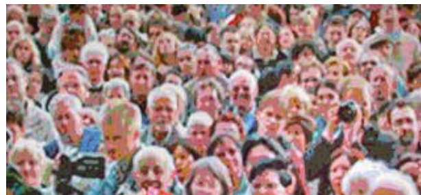
«Scenic People 34», MA 10-3, Oel auf MDF, 92 x 205 cm

Kontakt: Siedlergasse 22, A-7201 Neudörfel elisabeth.walden@live.at www.elisabethwalden.at