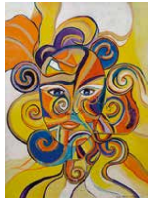
Face «Venice», Mischtechnik auf Leinwand, 80 x 60cm

1974* in Eisenstadt. 1997 Universität für Angewandte Kunst Wien – kontinuierliche Ausstellungstätigkeit seit 1993, darunter 2000 Einzelausstellung Galerie «M», Prag (CZ). 2003 Foire d'Automne Luxembourg, AAI Galerie. 2003 «ankäufe», Landesgalerie Burgenland. 2003 Lineart Gent, Belgien, AAI Galerie. 2004 Latin American Art Museum Miami, USA, AAI Galerie. 2005 «that's new», Galerie der IG bildende kunst Wien. 2007 «Förderpreis für Künstlerinnen», Landesgalerie Burgenland. 2009 «Natur & Feuer», Kulturhaus St. Andrä-Wördern. 2012 «Wir wollen nicht mehr, nur das Gleiche», WKO Mödling. Gestaltung der Fenster der Pfarrkirche Neudörfel 2007. Burgenländ. Landesjugendkulturpreis 1998, hält laufend Kunstkurse.