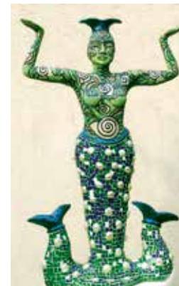
«NEREIDE», Keramikskulptur, Höhe: 68 cm

Nereide ist der griechische Begriff für Meerjungfrau. Sie konnten ihre Gestalt wechseln und manchmal als schöne Frauen und dann wieder als Tiere erscheinen. Meine Meerjungfrau wurde hohl aus Ton aufgebaut, drei Mal gebrannt und mit einem blau-grünem Mosaik aus Opalescentglas versehen.