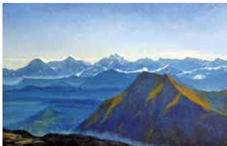
Berner Alpen mit Niesen, Oel, 70 x 100 cm

«Habe als Schüler gern und relativ gut gezeichnet; später nur noch fotografiert.»