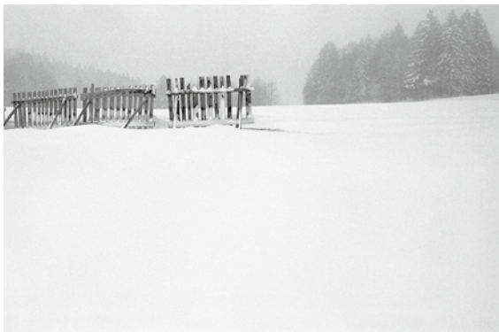
Saint-Ursanne, Foto schwarzweiss, fine art print auf Hahnemühlepapier, 65 x 80 cm

Beat Schertenleib (*1961) ist in Jens aufgewachsen und lebt heute in Zollikofen. Grundausbildung zum Tiefbauzeichner, später Zweitausbildung zum Buchhändler. Vielseitig interessiert, bildete er sich dann am GaF (Gruppe autodidaktischer Fotografen) zum Fotografen aus. Heute ist er als freischaffender Fotograf und bei der Kantonalen Denkmalpflege als Fotograf tätig.