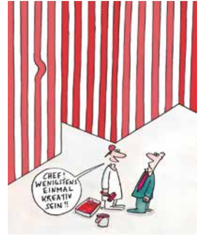
Kreativ sein, Poster, 46 x 32 cm

Kontakt: Landgarbenstrasse 47, CH-3052 Zollikofen