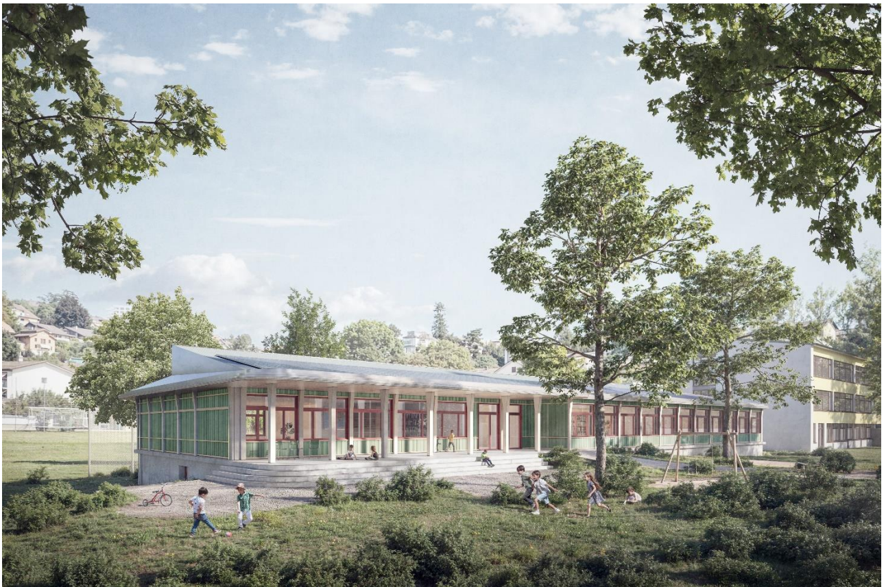
Abbildung 1: Visualisierung von Süden mit Kindergärten und Mehrzweckraum

Die Räume für die Tagesschule sind zwischenzeitlich aufgrund der Empfehlungen aus dem Bericht Schulraumplanung 1 dazugekommen. Das Schulhaus und die Turnhalle Steinibach stehen unter Denkmalschutz. Eine Erweiterung der Schulanlage erfordert eine hohe Sensibilität. Das vorliegende Projekt deckt alle Raumbedürfnisse ab. In Absprache mit der Kantonalen Denkmalpflege kann der Bau als zweigeschossiges Gebäude im Pavillonstil realisiert werden. Damit wird zugleich der Fussabdruck des Gebäudes verkleinert.