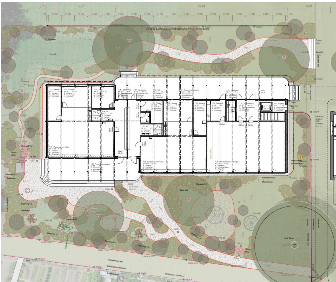
Abbildung 3: Grundriss Kindergärten und Mehrzweckraum, Ebene 1, Bauprojekt vom 08.08.2025