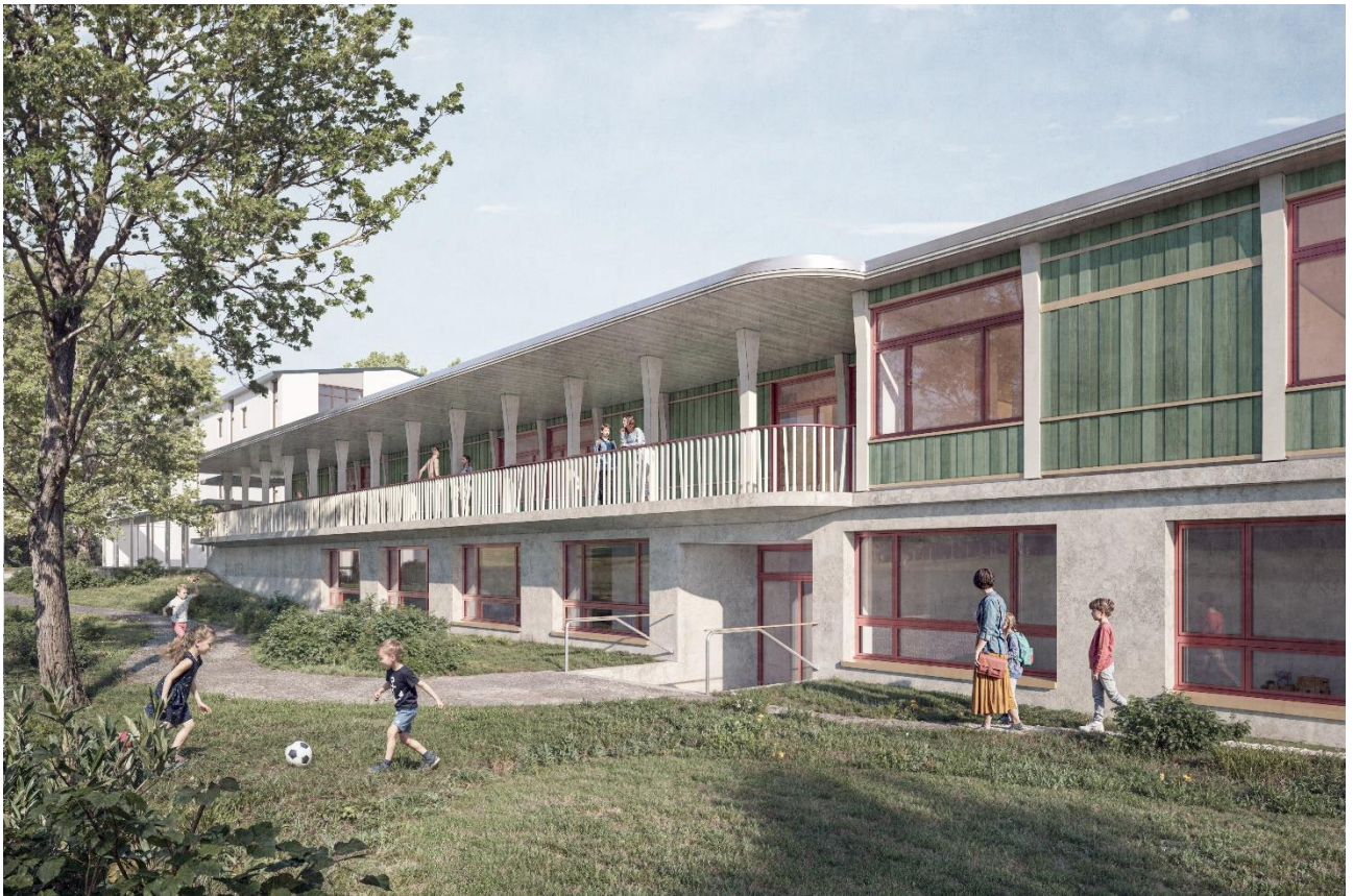
Abbildung 2: Visualisierung von Norden mit Tagesschule und Zugang zu den Kindergärten

Das Bauprojekt Kindergärten, Mehrzweckraum und Tagesschule wurde vom Architekten in Zusammenarbeit mit der Kommission Schulanlage Steinibach erarbeitet und liegt nun vor. Die Bedürfnisse der Nutzenden wurden in diesem Prozess präzisiert und sind in das Projekt eingeflossen. Die Fachplanenden haben ihre Arbeit aufgenommen, die Kostenberechnungen wurden präzisiert und liegen nun mit einer Genauigkeit von \pm 10\% vor.