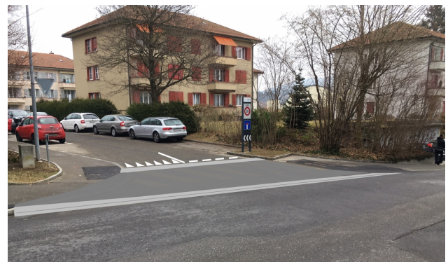
Abb. 3 Zelgweg mit Trottoirüberfahrt