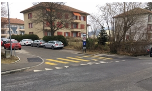
Abb. 2 Zelgweg bisher

An verkehrsorientierten Strassen mit signalisierten Geschwindigkeiten > 30 km/h eignen sich Trottoirüberfahrten, um die Sicherheit für zu Fuss Gehende im Bereich von einmündenden Strassen zu erhöhen. Auf Trottoirüberfahrten sind die zu Fuss Gehenden vortrittsberechtigt. An der Wahlackerstrasse wurden entsprechende Anpassungen bei den Einmündungen von Lüfterweg und Schmittestützli bereits realisiert. Ausstehend sind Trottoirüberfahrten bei der Einmündung Zelgweg (heute Fussgängerstreifen) und dem Zugang zum Friedhof (heute Vortritt zu Gunsten der Strassenbenutzenden). Bei den Einmündungen Hessweg, Lindenweg und der Zufahrt zur Einstellhalle Häberlimatte sind Trottoirüberfahrten angedeutet. Die Gestaltung entspricht aber weder den Normen noch den anderen bereits erstellten Trottoirüberfahrten in der Gemeinde Zollikofen. Die Trottoirüberfahrten sind ein gutes Mittel, um die Schulwegsicherheit zusätzlich zu verbessern.