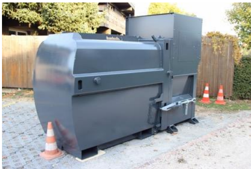
Abbildung 1: Bsp. einer Containerpresse

Um bei grossen Überbauungen den Platzbedarf für die Abfallbereitstellung so klein wie möglich gestalten zu können, lässt das neue Abfallreglement den Einsatz von Presscontainern zu. Denkbar sind auch Quartierssammelplätze mit Presscontainern. Die Presscontainer müssen bezüglich Sicherheit (Bedienung) den gültigen Vorschriften entsprechen. Presscontainer kommen nur dort zum Einsatz, wo gegenüber herkömmlichen Containern (800 l) eine wesentliche Platzeinsparung resultiert. Die Häufigkeit der Entleerungszyklen nimmt dadurch nicht ab. Deshalb muss auch während heissen Sommertagen nicht mit zusätzlichen Geruchsimmissionen gerechnet werden.