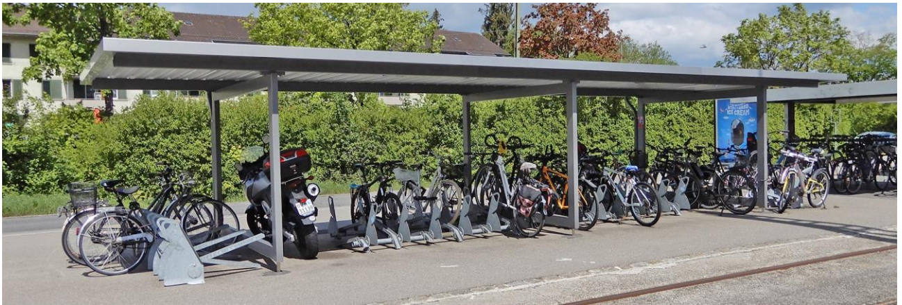
Beispiel Überdachung

sind. Am Rand des Platzes (1a) werden sogenannte Anlehnbügel montiert; so dass auch hier Velos abgestellt werden könnten. Die Publibike-Ausleihstation bleibt an ihrem heutigen Standort (1b).