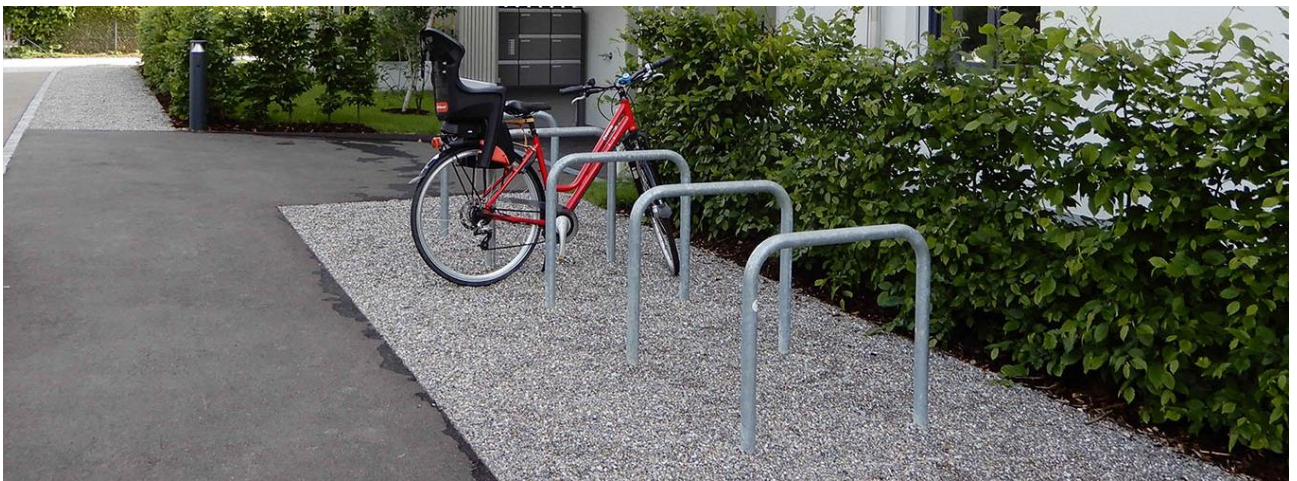
Beispiel Anlehnbügel