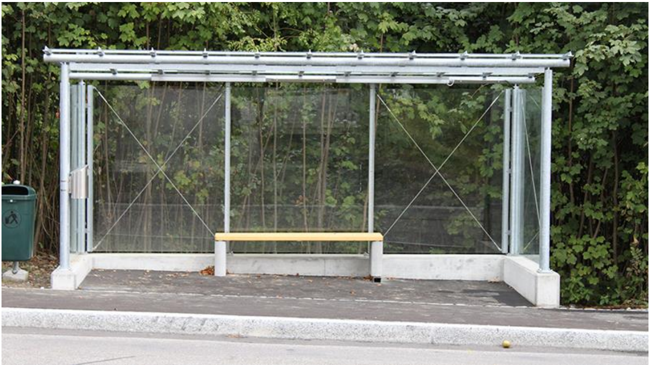
Beispiel Personenunterstand