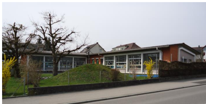
Kindergarten Lindenweg 2A