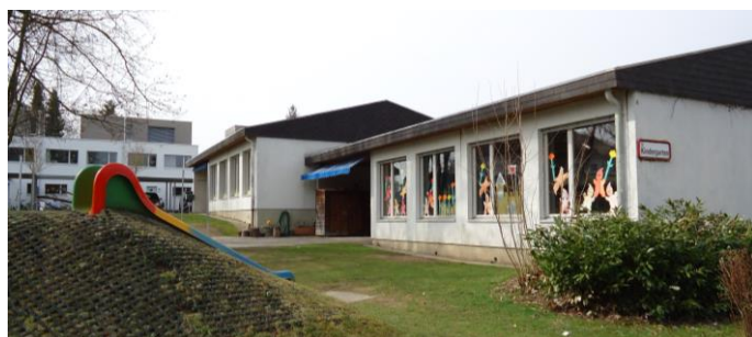
70 Kindergarten Lindenweg 2