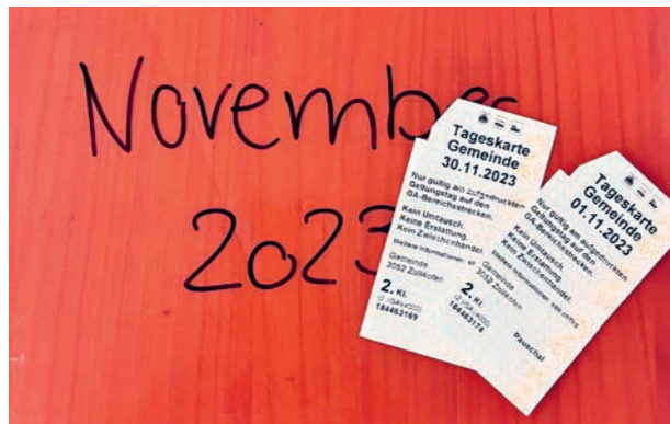
Goodbye Tageskarte Gemeinde