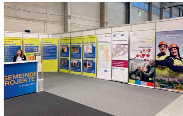
Gemeindeplatz bei den Energy Future Days an der Hausbau und Energie Messe BERNEXPO