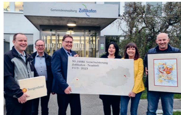
50 Jahre Verschwisterung Zollikofen und Neudörfli