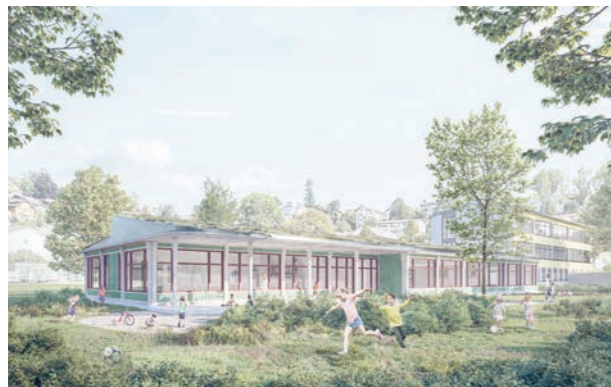
Projekt «Grünspecht» Perspektive, Neubau Schulanlage Steinibach