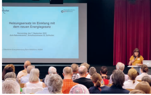
Klima- und Energieanlass