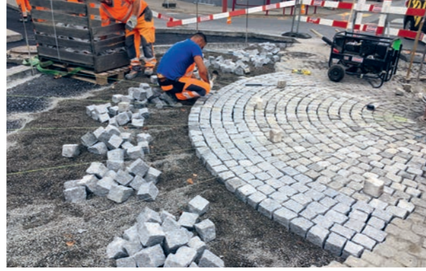
Wiederherstellung Kreisel Unterzollkofen