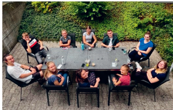
Mittagspause Mitarbeitende der Gemeindeverwaltung Zollikofen