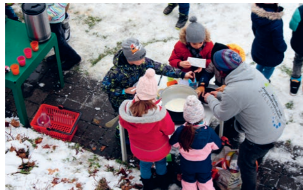
Aktivitäten bei Kijufa