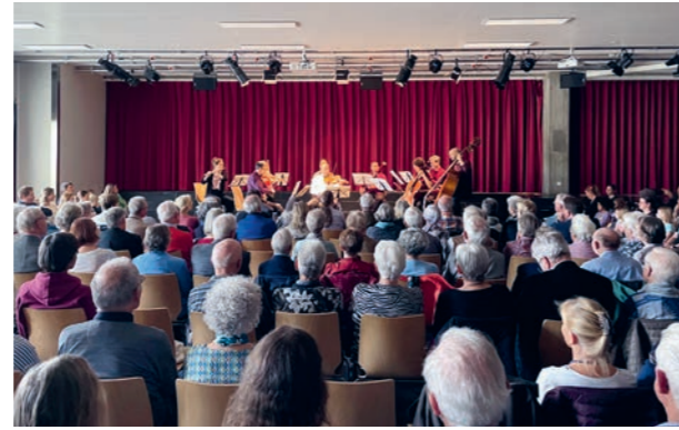
Matineekonzert Kammerensemble des Berner Symphonieorchesters

Stellen konnten teilweise nur mit mehrmaliger Ausschreibung besetzt werden.