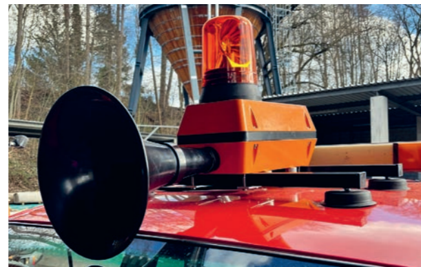
Sirene auf dem Autodach