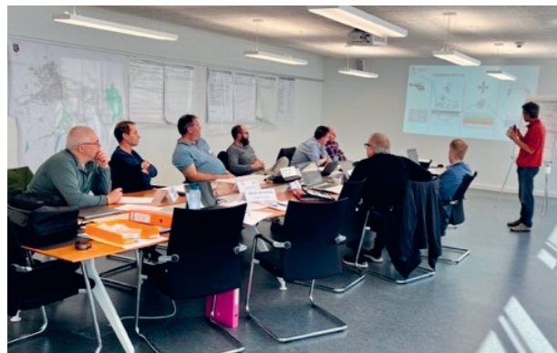
Schulung des Regionalen Führungsorgans MüZo plus