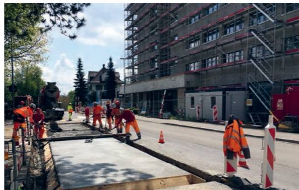
Betonplattenbau Haltestelle Lüftern