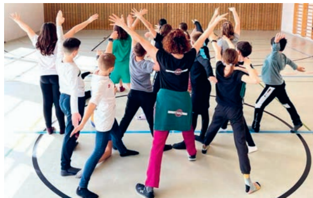
Sport, ein wichtiger Ausgleich im Schulalltag