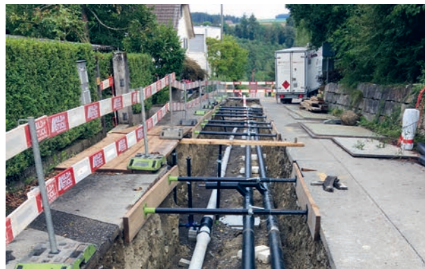
Fernwärme- und Wasserleitung im Steinibachweg