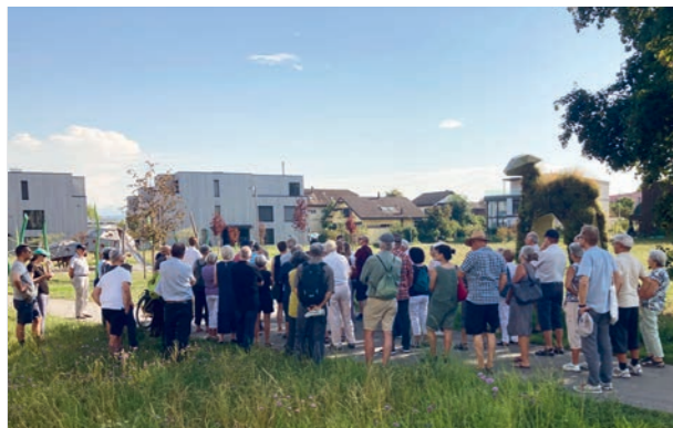
Abendspaziergang neue Überbauungen 2023, Treffpunkt Schäferhöhe

zu ändern. Während der öffentlichen Auflage gingen keine Einsprachen ein. Der Kanton genehmigte die Änderung am 16. August.