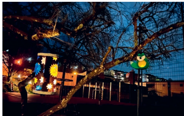
Weihnachtsstimmung beim Standort Steinibach