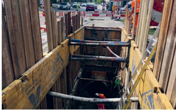
Baustelle Kreisel Unterzollkofen