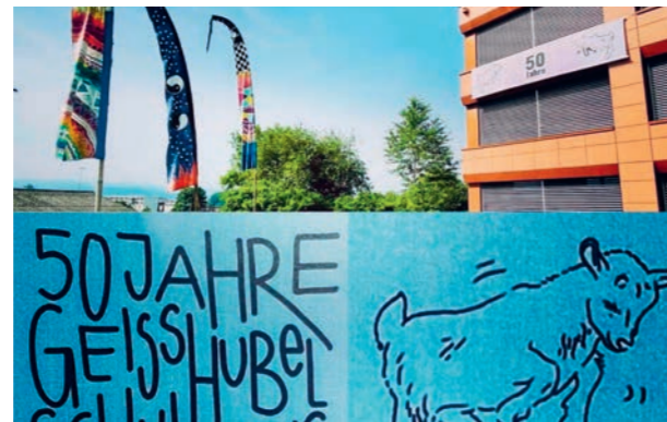
50 Jahre Schulhaus Geisshubel