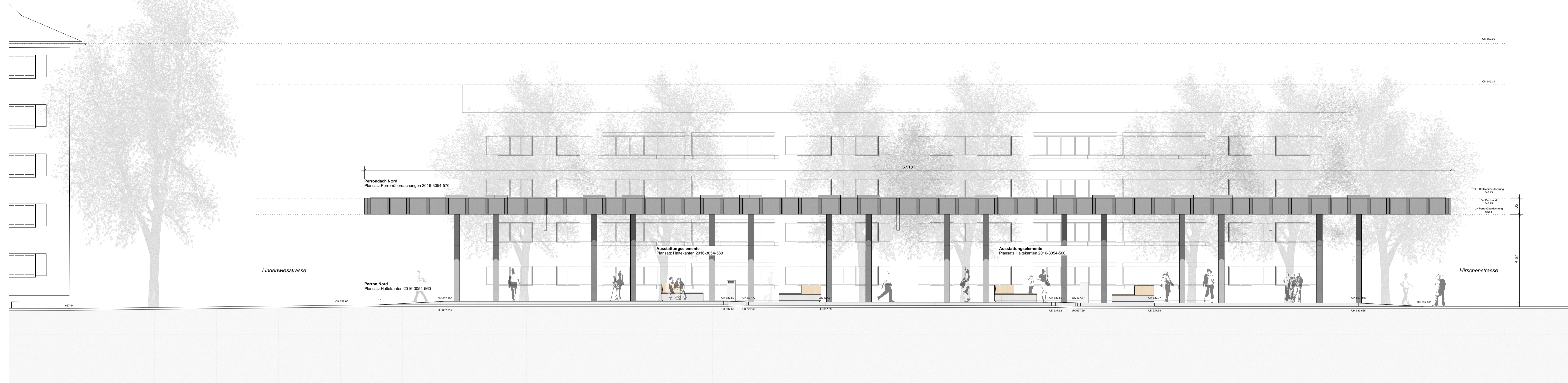
Ansicht F_Südansicht Teilprojekt Bushof Perron 1