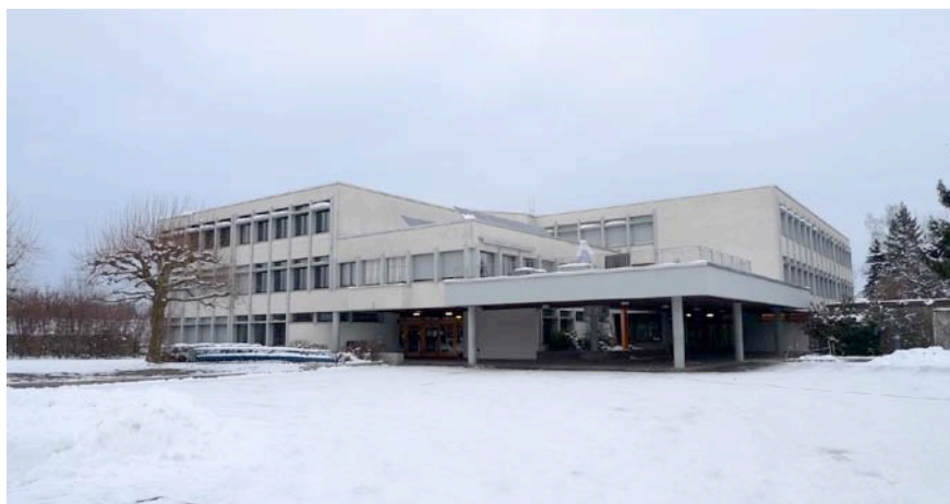
Foto des 1971 erbauten Schulhauses Rosenau

Die Schulanlage soll mit der Sanierung ein inneres „Face-Lifting“ erhalten. Dabei wird mit einer Sanierung und Umbau in den bestehenden Kubaturen mit geringen Ausbaumöglichkeiten gerechnet.