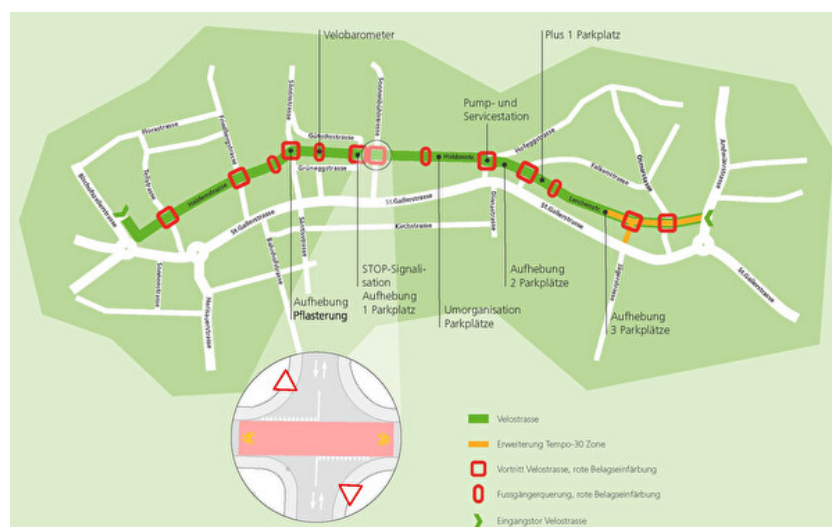
Abb. 4 Schematische Darstellung der geplanten Velostrasse, stadtgossau.ch

Über die Bischofszellerstrasse erreicht man direkt die geplante Velostrasse (Haldenstrasse) welche das Stadtgebiet parallel zur St. Gallerstrasse erschliesst.