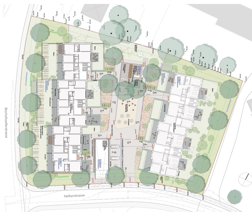
Abb. 2 Richtprojekt Situation Umgebung, Uniola Landschaftsarchitekten, Zürich und K&L Architekten, St.Gallen, 28. Februar 2025 (Revision: 8. Oktober 2025)

Das Siegerprojekt des Investorenverfahrens sieht den Neubau von zwei länglichen, viergeschossigen Wohnbauten parallel zur Bischofszellerstrasse vor. Im Zentrum des Areals wird ein begrünter Innenhof definiert. Durch das Areal verläuft ein Weg in Nord-Süd Richtung.