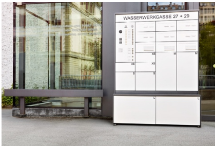
Abb. 9 Depotbox an der Wasserwerksgasse 27+29, Bern