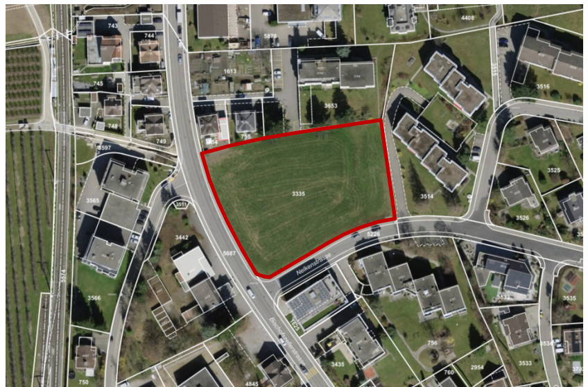
Abb. 1 Übersicht Planungsgebiet (Geoportal, 2. August 2023).

Das Planungsgebiet liegt im Norden der Stadt Gossau an der Bischofszellerstrasse, rund 600 m vom Ortszentrum. Es umfasst rund 0.54 ha. Südlich der Parzelle verläuft die Nelkenstrasse, welche nach Osten in ein grösseres Wohnquartier führt. Im Norden erstreckt sich angrenzend ein Wohn- und Gewerbegebiet.