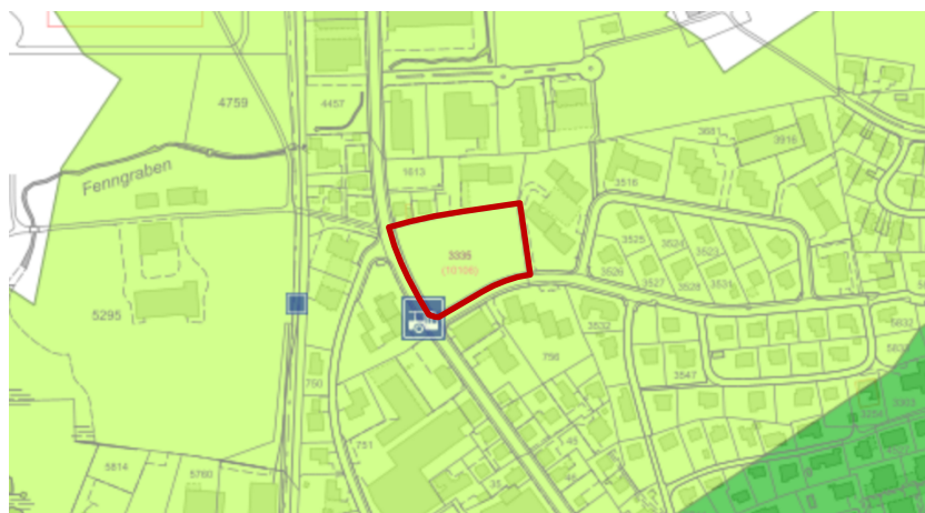
Abb. 5 ÖV-Güteklassen und Haltestellen (unbestimmter Massstab, Geoportal, 4. August 2023).

Diese Bushaltestelle soll erhalten bleiben und neugestaltet werden. Das Tiefbauamt des Kantons St. Gallen (TBA) beabsichtigt dabei die Haltestelle mit einer Busbucht in Fahrtrichtung stadtauswärts auszustatten. Mit der Regelung im Sondernutzungsplan wird der Raumbedarf für die neue Busbucht im Planungsgebiet gesichert.