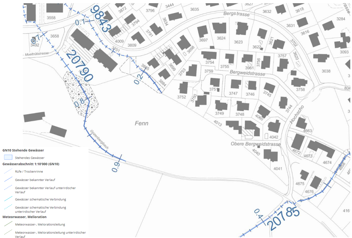
Abb 1: Gewässernetz GN10 1:2'000 (vgl. Geoportall)