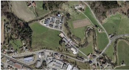
Die ARA Oberglatt bei Flawil

Die gemeinsam von den Gemeinden Flawil, Gossau und Degersheim betriebene ARA Oberglatt wurde letztmals in den Jahren 1999 bis 2003 ausgebaut. Jetzt war ein erneuter Ausbau nötig. Die biologische Reinigungsstufe musste erweitert werden, da sie ihre Kapazitätsgrenze erreicht hatte. Aufgrund des hohen Anteils des gereinigten Abwassers im Gewässer und der damit verbundenen hohen Belastung der Glatt musste zudem eine EMV-Stufe erstellt werden. Dies wird seit 2016 auch von der eidgenössischen Gewässerschutzgesetzgebung verlangt. Das gesetzlich vorgeschriebene Ziel ist die Reduktion von 80 Prozent aller Mikroverunreinigungen.