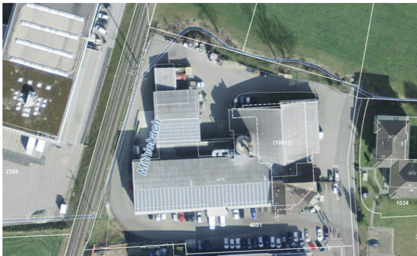
Abb. 1; Orthophoto mit Gewässernetz geoportal.ch (ohne Masstab)