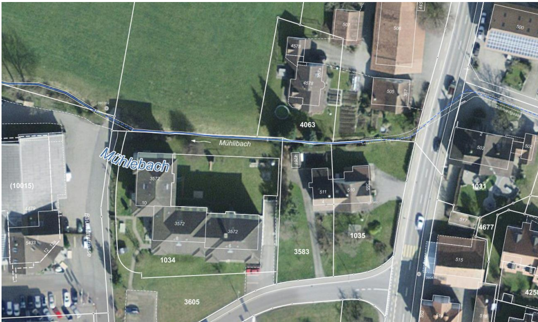
Abb. 3; Orthophoto mit Gewässernetz geoportal.ch (ohne Masstab)