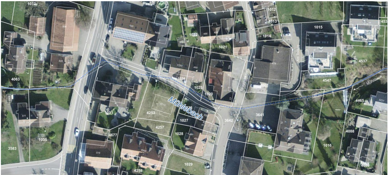
Abb. 4; Orthophoto mit Gewässernetz geoportal.ch (ohne Massstab)