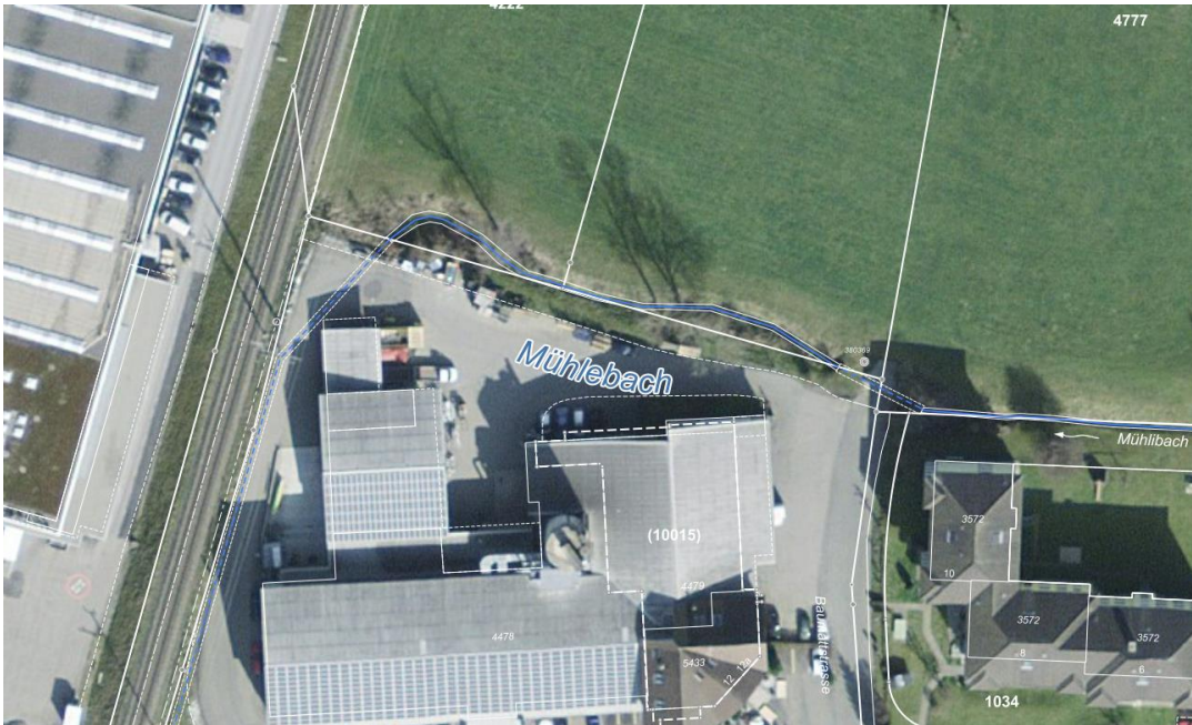
Abb. 2; Orthophoto mit Gewässernetz geoportal.ch (ohne Massstab)