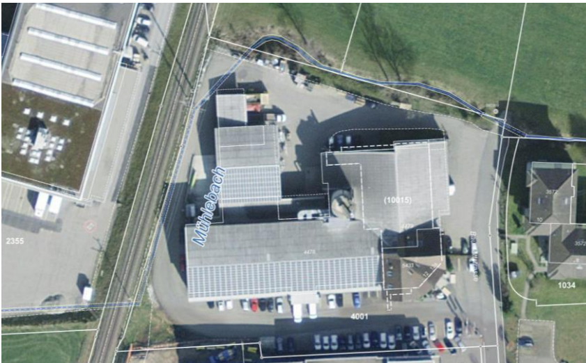
Abb. 1; Orthophoto mit Gewässernetz geoportal.ch (ohne Massstab)