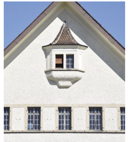
Das ehemalige Lagerhaus der Schaffhauser Silo AG, ein grossvolumiger Bau mit steilem Satteldach, verfügt in der Giebelplatte über einen Erker und darunter einen dem Bauernhaustypus des 18. Jahrhunderts entlehnten Fensterwagen.