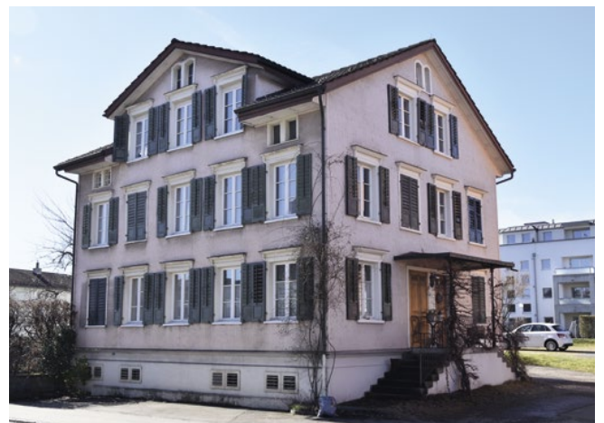
Dieses biedermeierliche Doppelwohnhaus steht gegenüber der Einmündung der Oberwattstrasse und der Florastrasse in die Bischofszellerstrasse und prägt entscheidend die Kreuzung. Auf der Nordseite befindet sich der überdachte Eingang mit der doppelläufigen Freitreppe und den zwei profilierten Hartholztüren mit den Oberlichtern.