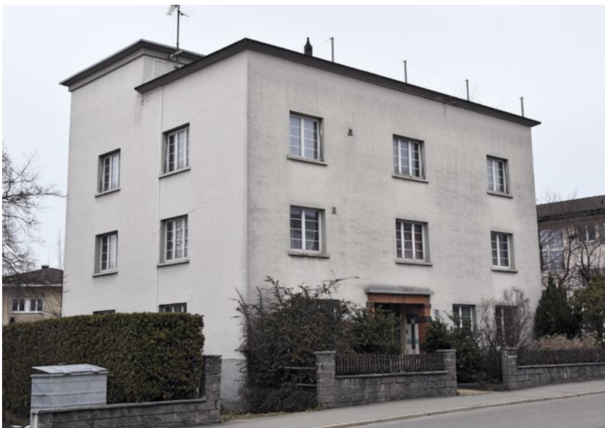
Dieses stark vom Neuen Bauen beeinflusste Wohnhaus an der Herisauerstrasse 65 wurde 1932/33 von einem unbekanntem Architekten für Eliseo Carniello erbaut. Typisch sind das gestaffelte Flachdach, die rahmenlosen Fenster sowie der Verzicht auf jegliche Gliederung.