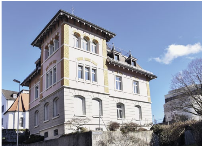
Die an italienische Palazzi erinnernde Villa Friedberg wurde 1904 für Sylvester Schaffhauser erbaut und war von Anfang an mit Zentralheizung ausgestattet. Charakteristisch ist der südwestliche Fassadenturm mit dem loggiaähnlichen Obergeschoss und den Rundbogenfenstern mit den klassizistischen Säulen.