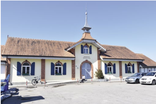
Der ehemalige Schiessstand im Niederdorf wurde 1908/09 im Auftrag der Politischen Gemeinde Gossau anstelle einer älteren «Schützenhütte» erbaut. Heute befindet sich hier das Versammlungslokal des Tambourenvereins Fürstenland Gossau.

Eine bemerkenswerte Kleinbaute, wie man sie im Gossauer Stadtbild sonst nicht mehr antrifft, ist die 1920 im Auftrag der Dorfkorporation erstellte Pumpstation des Wasserwerks Gossau an der Verzweigung Hirschenstrasse / Mooswiesstrasse. Der unbekannte Architekt sah sich hier vor die Aufgabe gestellt, welchen architektonischen Stil er wählen sollte. Die Kommission entschied sich schliesslich für eine neubarocke Variante mit Säule, Eckrustika und zwei Rundbogenöffnungen an der Südwestseite und setzte ein Walmdach mit Biberschwanzziegeldeckung, Fledermausgaube und verputzter Untersicht darauf.