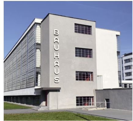
Das Bauhaus-Schulgebäude in Dessau-Rosslau entstand 1925/26 nach Plänen von Walter Gropius für die Kunst-, Design- und Architekturschule Bauhaus. Die Aufnahme des restaurierten und teilweise rekonstruierten Gebäudes stammt vom Oktober 2019.

In Gossau stehen drei Wohnbauten, die dem Neuen Bauen zuzuordnen sind. Beim Neuen Bauen grenzten sich die Architekten bewusst von den herkömmlichen, traditionellen Häusern ab. Man setzte auf das Flachdach, verwendete konsequent neue Materialien wie Glas, Stahl oder Beton und verzichtete auf jegliches schmückende Ornament.