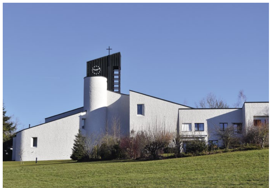
Ihr Gepräge erhält die Paulus-Kirche von den wenig gebrochenen Dachlinien und dem Kontrast zwischen den dunkelbraun verschalteten Partien und den weiss verputzten Mauern. Zwischen den Pultdachbauten des Saaltraktes und des Pfarr- sowie des Mesmerhauses erhebt sich über halbkreisförmigem Grundriss das Schiff, überdeckt vom schwach geneigten Halbkegeldach, das im schlichten Turmaufsatz endet.