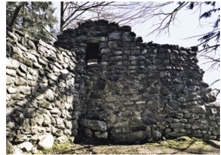
Die Burgruine Helfenberg, das älteste Gossauer Kulturobjekt.

Die Burganlage ist vermutlich im 11. Jahrhundert entstanden.