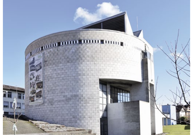
Eine der architektonisch interessantesten neueren Kirchen in der Ostschweiz. Die Anlehnung an Mario Bottas «casa rotonda» in Stabio im Tessin (und dieser wiederum an die Villa Rotonda von Andrea Palladio in Vicenza!) bringt südliche Stimmung in das Gossauer Ortsbild.