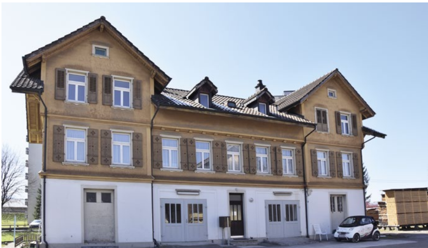
Das erste Aufnahmegebäude der Bahnstation Gossau an der Linie Zürich–St. Gallen wurde 1856 erstellt. 1915 wurde es wegen der Verlegung der Eisenbahnlinie abgebrochen und am heutigen Standort an der Flawilerstrasse wieder aufgestellt.

Nach der 1805 erfolgten Aufhebung der Fürstabtei wurde Gossau mit Arnegg zu einer Gemeinde im 1803 neu gegründeten Kanton St. Gallen vereinigt. Verkehr, Handel und Industrie führten vor allem ab der Mitte des 19. Jahrhunderts zu einer deutlichen Veränderung des Siedlungsbildes. So erforderte die neue Eisenbahnlinie von Zürich nach St. Gallen 1856 die Erstellung eines ersten Bahnhof-Aufnahmegebäudes in Gossau. Aber auch die Einführung der allgemeinen Schulpflicht in der Schweiz 1874 führte zu neuen Bauaufgaben, nämlich zum Bau von Schulhäusern. Gossau kann mit zwei äusserst prominenten Beispielen aufwarten: dem ehemals reformierten Schulhaus auf dem Haldenbüel und dem östlich davon gelegenen, ehemals katholischen Notkerschulhaus. Daneben entstanden neu auch Verwaltungsbauten wie das Gemeindehaus, das Ende des 19. Jahrhunderts als Gemeinschaftsgebäude mit Post und Telegraf erstellt wurde; ebenso Gebäude für die Versorgung mit Elektrizität und Wasser. Gossau verfügt noch über eine weitere Kleinbaute, die heute allerdings nicht mehr dem ursprünglichen Zweck dient: den ehemaligen Schiessstand im Niederdorf.