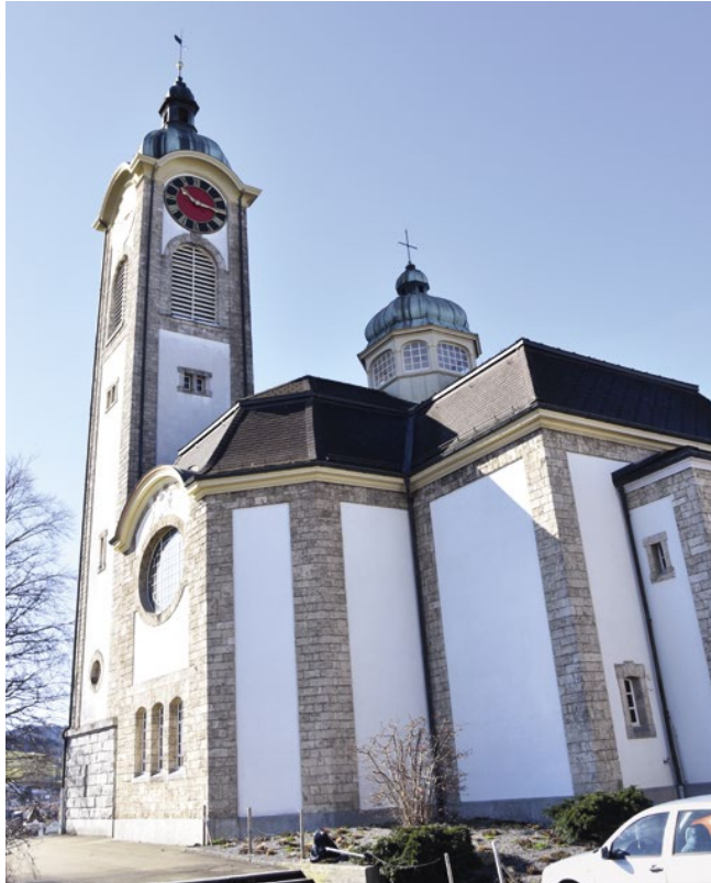
Die reformierte Kirche Haldenbühl prägt – zusammen mit der katholischen Andreas-kirche – noch heute massgeblich das Gossauer Ortsbild.