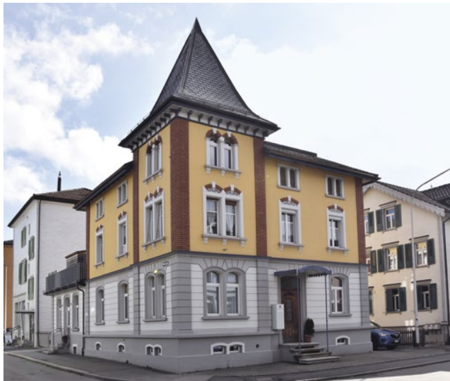
Italienischen Geist atmet auch dieses um 1900 errichtete Gebäude an der Bahnhofstrasse 15. Es dürfte vom gleichen Baumeister stammen wie die ebenfalls mit einem charakteristischen Fassadenturm ausgestattete Villa an der Parkstrasse 16, östlich des Notkerschulhauses.