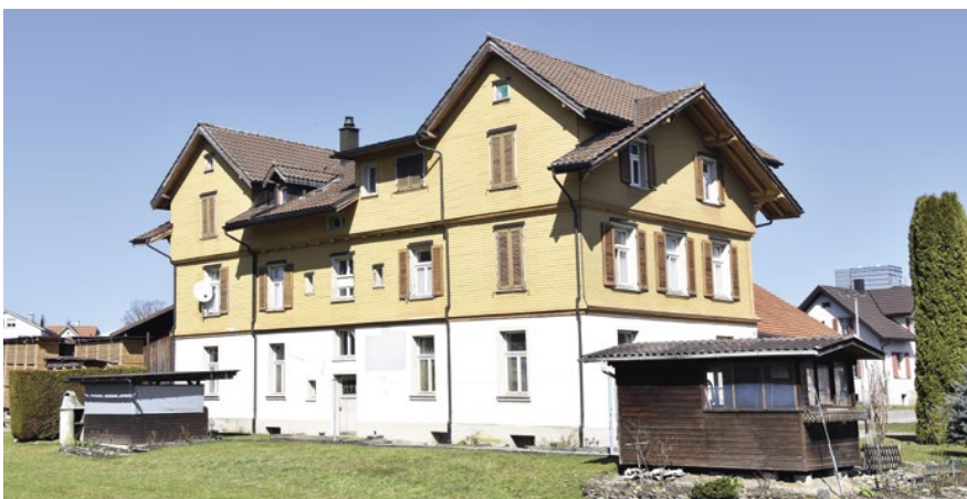
Unverkennbar das Aufnahmegebäude eines Bahnhofs. Nur führte nie eine Eisenbahnlinie an der Flawilerstrasse durch!