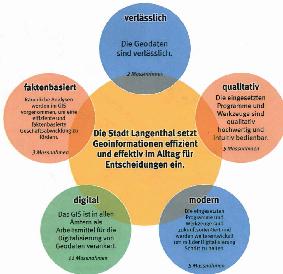
Abbildung 2: Schematisierte Zusammenfassung der am 7. Juli 2024 genehmigten GIS-Strategie.

Am 7. Juli 2024 hat der GR die GIS-Strategie genehmigt, bestehend aus einer Vision, fünf Zielen und 26 Massnahmen für den Betrieb und die Weiterentwicklung des GIS (Abbildung 2). Sie bildet die strategische Grundlage für die neue Ausrichtung des GIS.