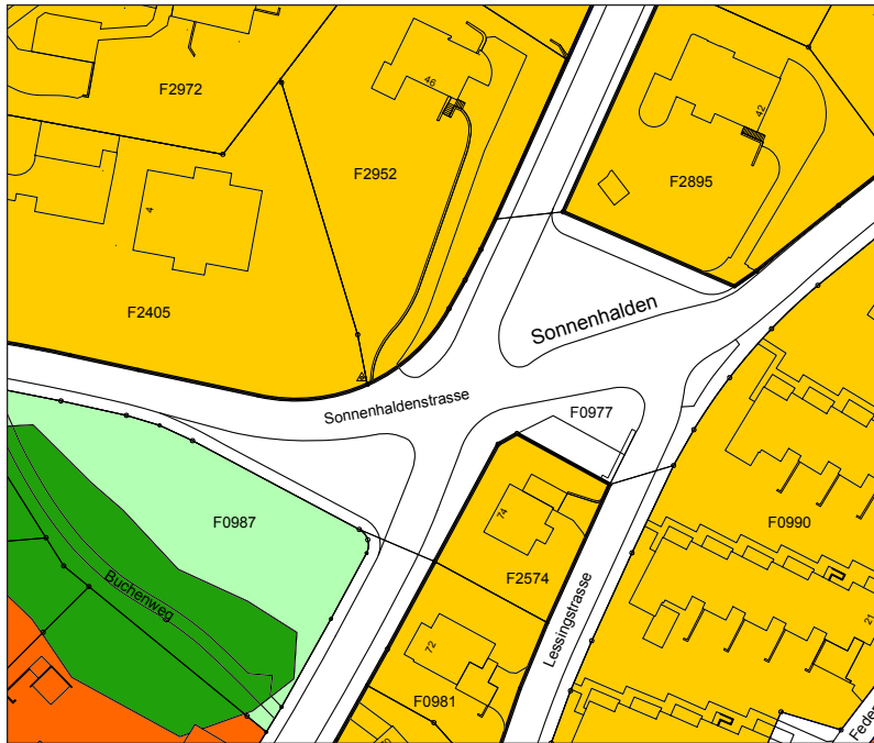
Ausschnitt rechtskräftiger Zonenplan