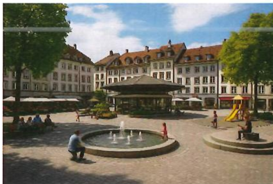
Abb. 2: KI generierte Visualisierung (Quelle: ChatGPT.com, generiert am 14.5.2025)

Wir haben unsere Idee mal mit einem einfachen Prompt von ChatGPT visualisieren lassen: