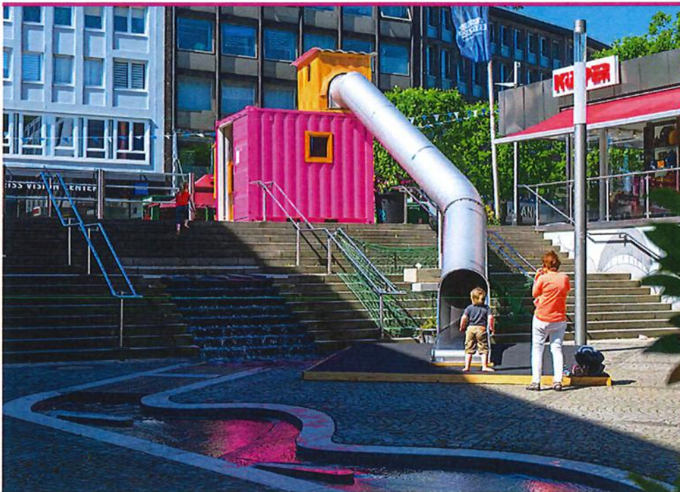
Abb. 3: Kukuluk-Box mit künstlichem Bach in der Stadt Bochum 1

Auch mit kleinem finanziellen Aufwand könnte man den Marktplatz maximal aufwerten. Es braucht einfach Ideen anstatt grössenwahnsinnige Projekte, welche an den Turmbau zu Babel erinnern. Wir denken dabei z.B. an eine Kukuluk-Box, welche nicht alle Welt kostet und auf unserem Marktplatz sehr gut integriert werden könnte, ein Wasserspiel, kleinen Bach oder einen Brunnen, Sitzgelegenheiten und Bäume würden den Platz für wenig Geld aufwerten.