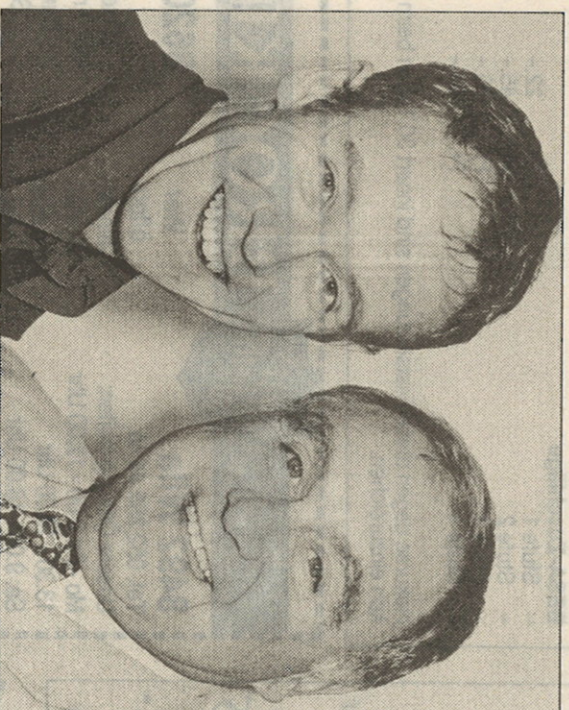
«Gäld wie Heu» mit Erich Vock (l.) und Jörg Schneider

Kaum hat dann das neue Jahr begonnen, schon gastiert das Balogh Ballett Prag mit dem wunderschönen Ballett «Der Nussknacker» von Peter Illitsch Tschalkowsky in Illnau. Das Meisterwerk wird in abendfüllender