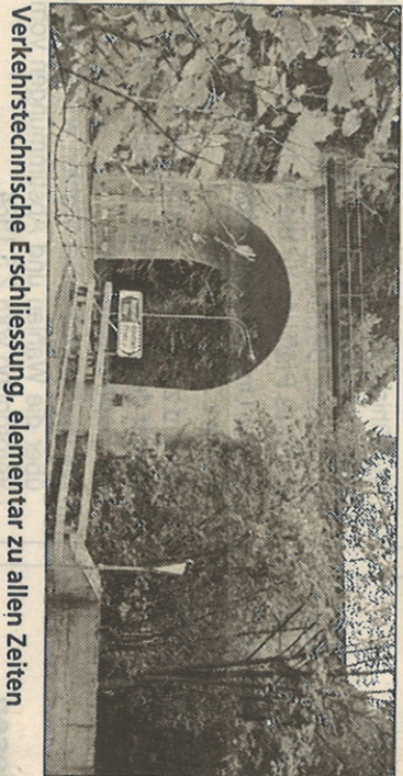
Verkehrstechnische Erschliessung, elementar zu allen Zeiten

Die Kempt und die Natur Die Hinweistafeln geben auch Auskunft über Flora und Fauna, die entlang des Flusses zu bewundern ist. So lernt man beispielsweise, dass sich in der Kempt Rollegel und Was-