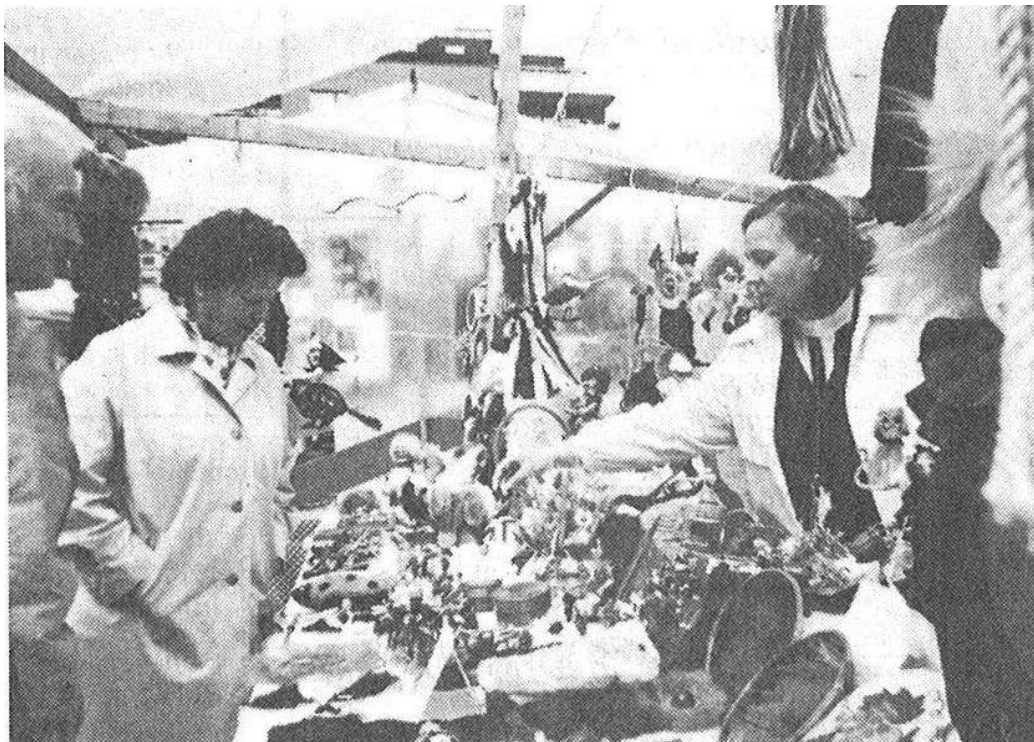
Aus den Anfangszeiten: Der Märt 1983