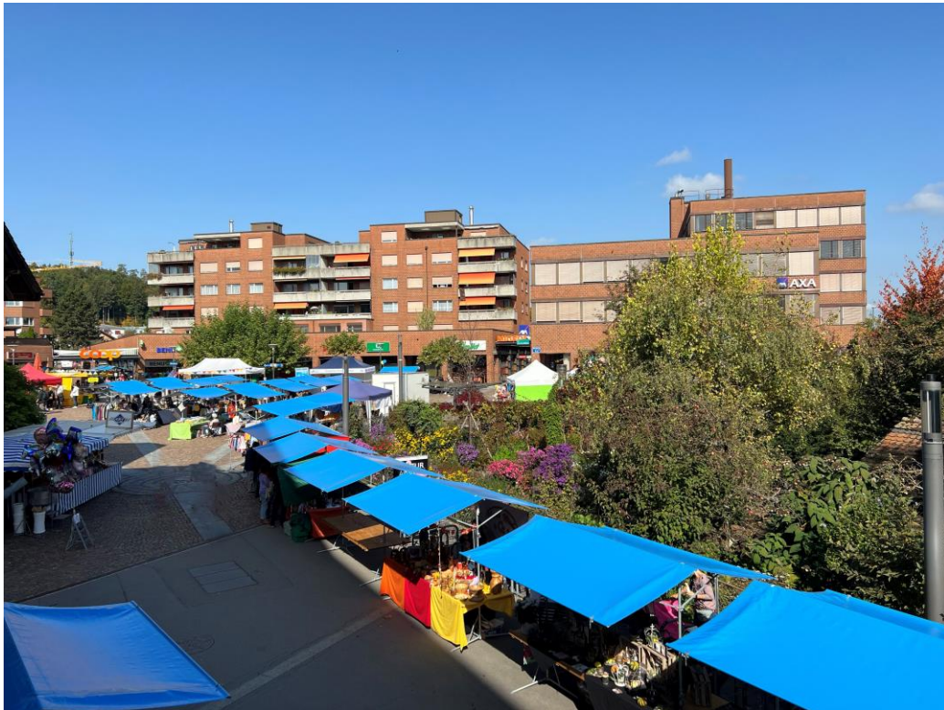
Der Märt, wie er sich heute präsentiert.