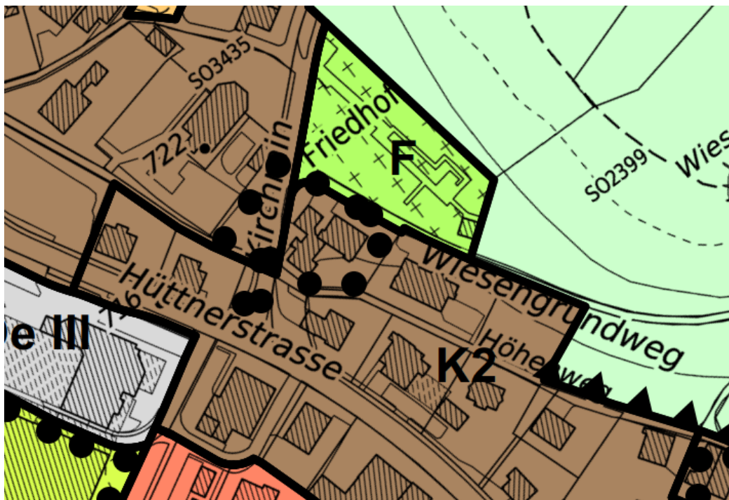
Zonenplan Stadt Wädenswil, Ausschnitt Schönenberg, Stand: Gesamtrevision 2023

Im heute gültigen Zonenplan überlagert der Gestaltungsplanperimeter die Kernzone K2 (mit schwarzen Punkten gekennzeichnet). Die Zonierung bleibt im Zuge der Gesamtrevision unverändert.