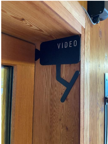
Piktogramm für Kamera 1 (Haupteingang / Kassenschalter)