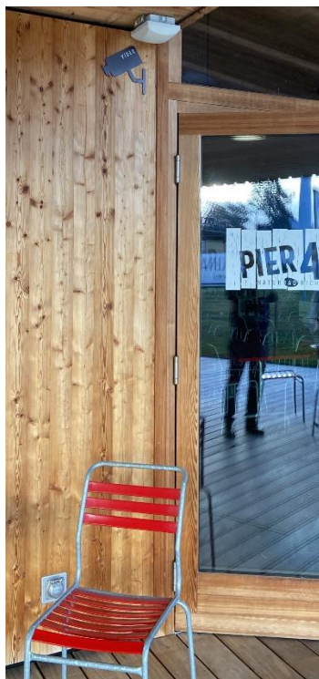
Piktogramm für Kamera 2 (Terrasse / Zugang Café)