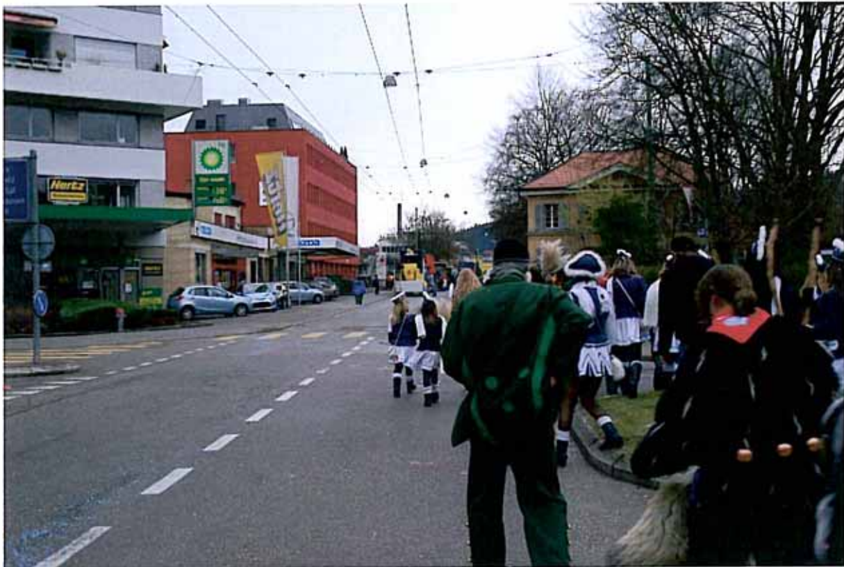
Fasnachtswagen und Teilnehmer auf Zeughausstrasse