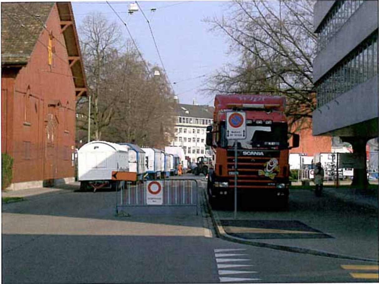
„Ein- und Ausfahrt“ Knie auf Zeughausstrasse