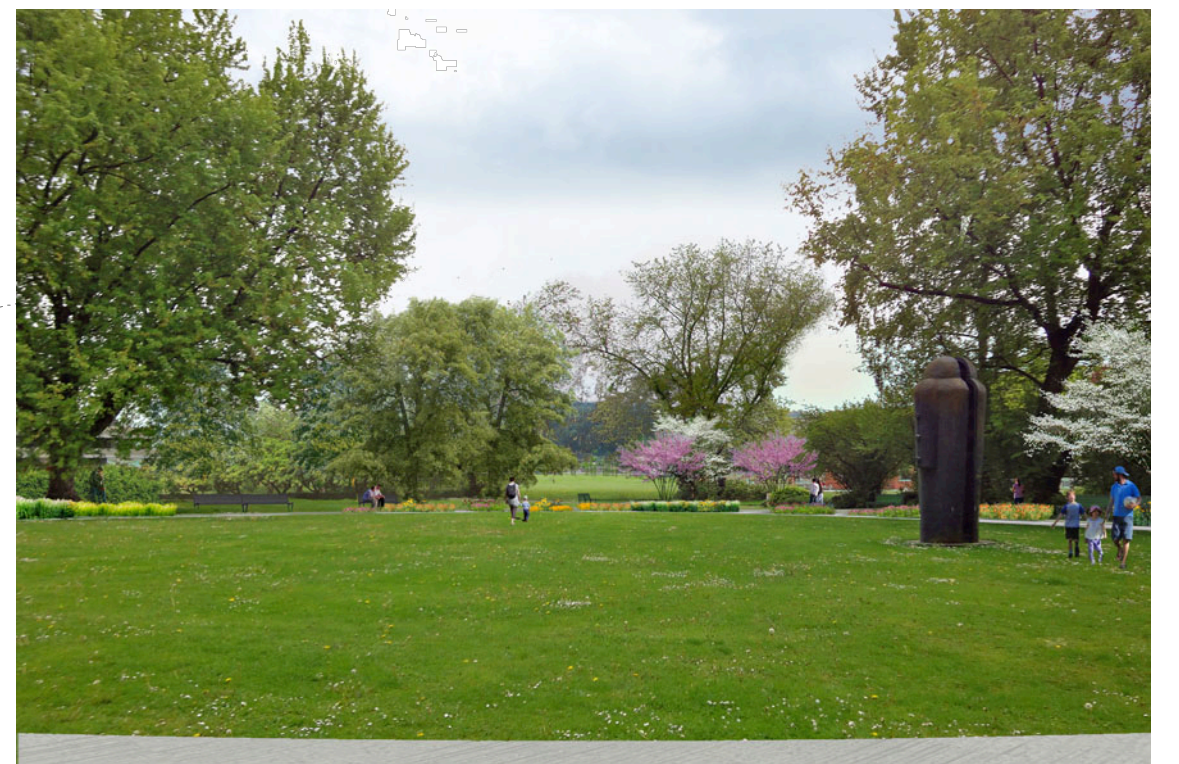
Blick in südliche Richtung