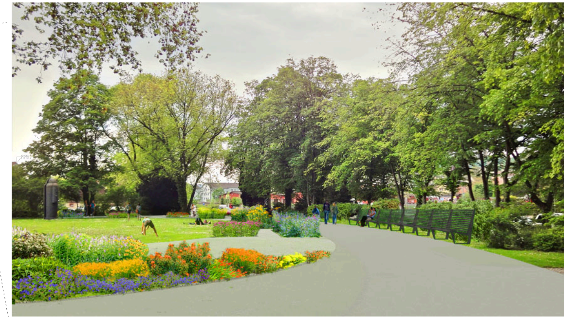
Blick in westliche Richtung mit langer Sitzbank und Staudenbeeten