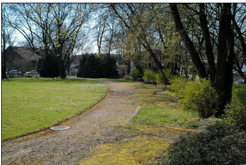
Nördlicher Parkrand längs Hegifeldstrasse. Im Hintergrund der Hauptzugang.