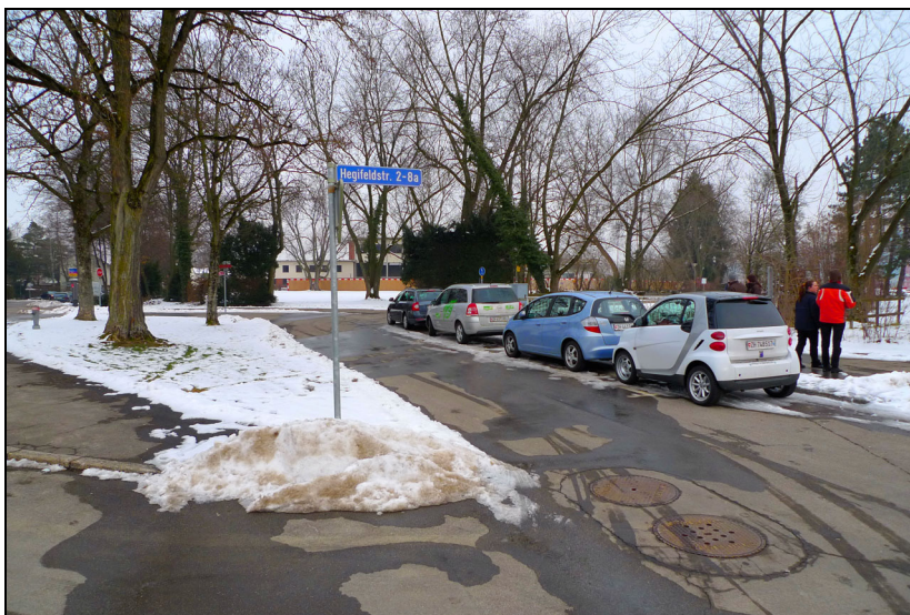
Hauptzugang zur 3. Etappe des Eulachparks aus Richtung Oberwinterthur. Alte Buswendeschleife.