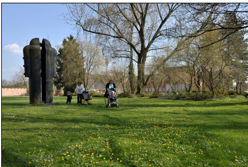
Blick in südöstlicher Richtung. Skulptur "Der zerrissene Mensch" von Michael Keller und Hans-Karl Angele. Im Hintergrund das TMZ-Schulhaus.