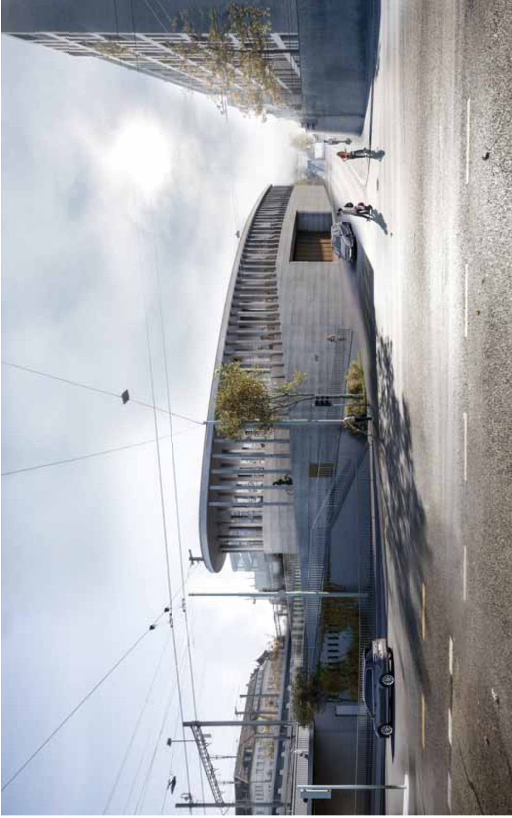
Ansicht von Wulfingerstrasse