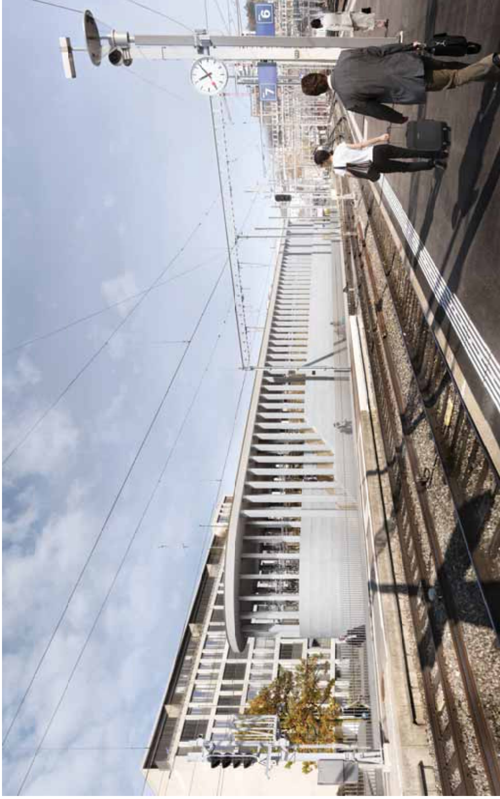
Ansicht von Perron Gleis 6 und 7