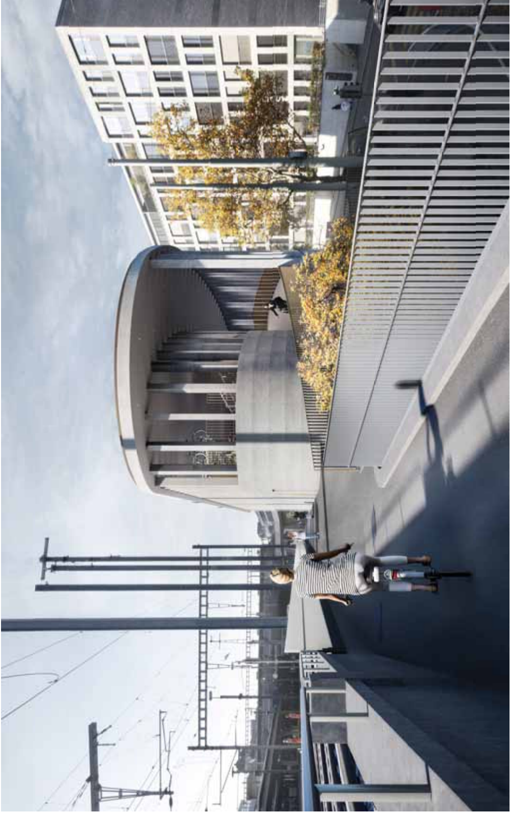
Ansicht von Wulfingerbrücke