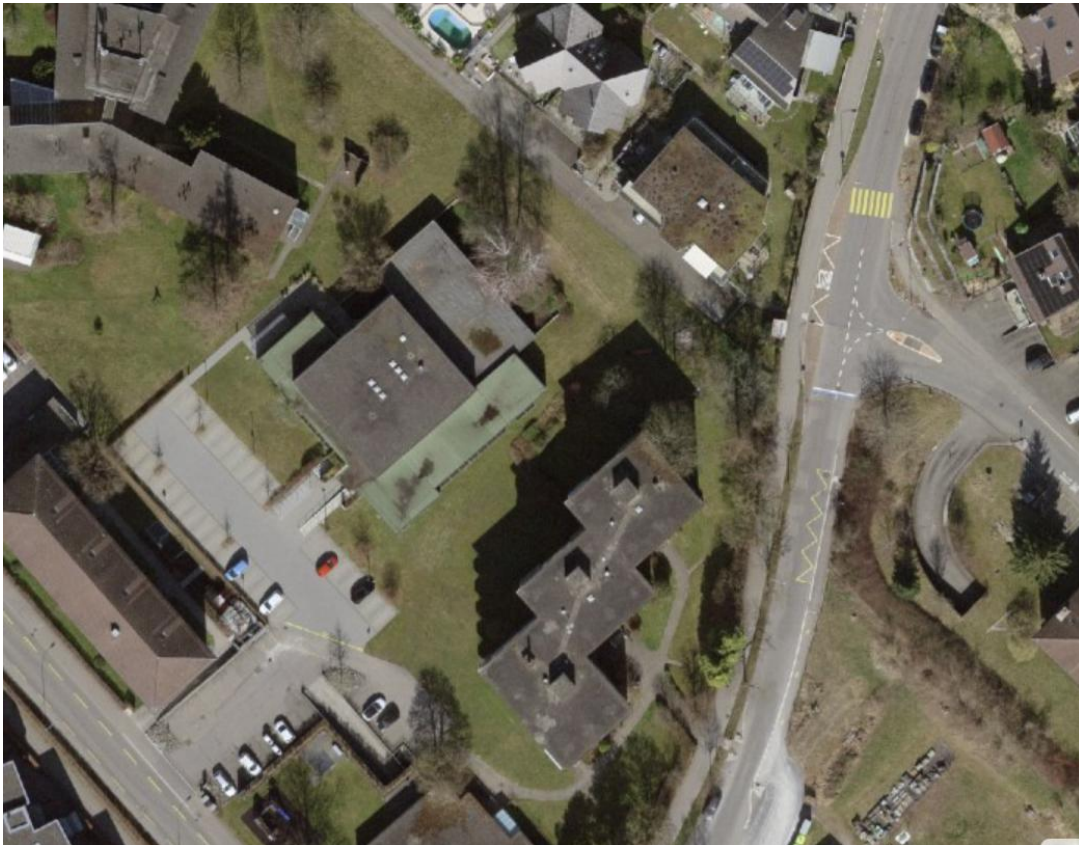
Luftbild Wagerenstrasse 45