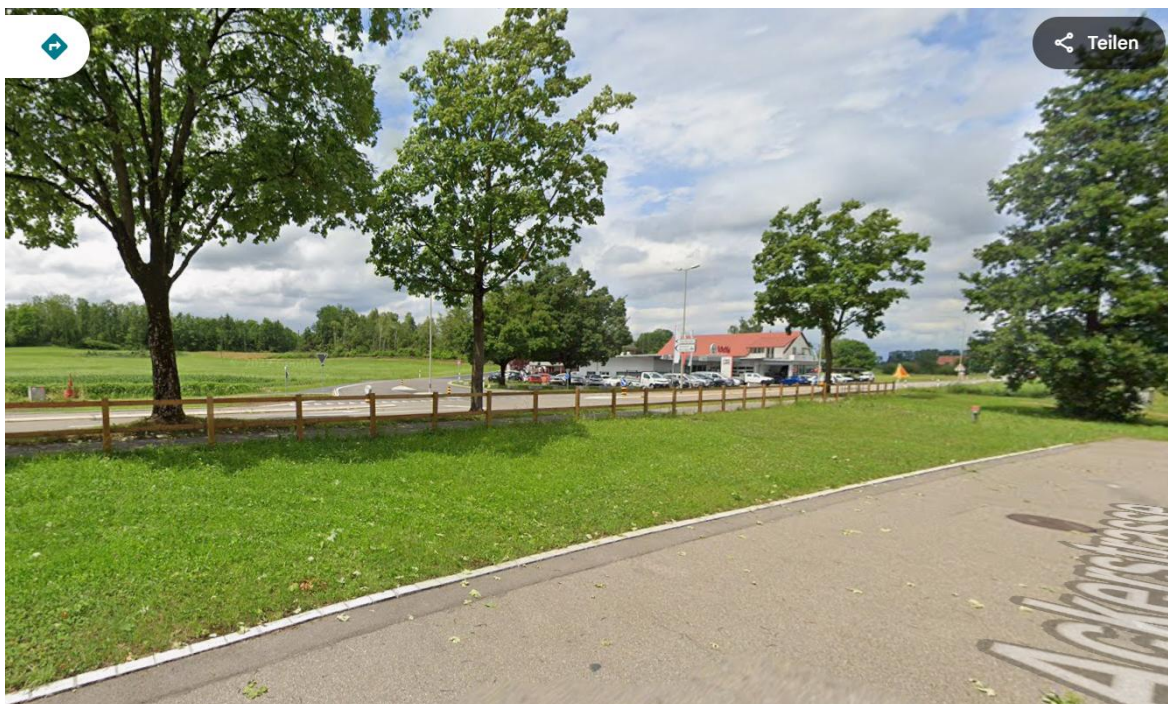
Rabatte Ackerstrasse 56/99, heutiger Zustand

Es ist nicht einzusehen, weshalb die Stadt Uster diesen hohen Betrag für die Erstellung von 14 Parkplätzen einsetzen soll. Hat sie wirklich keine anderen Ideen zur Steigerung der Attraktivität von Uster und zum Motto «Uster steigt um»? Das Grundstück ist heute eine Grünfläche: