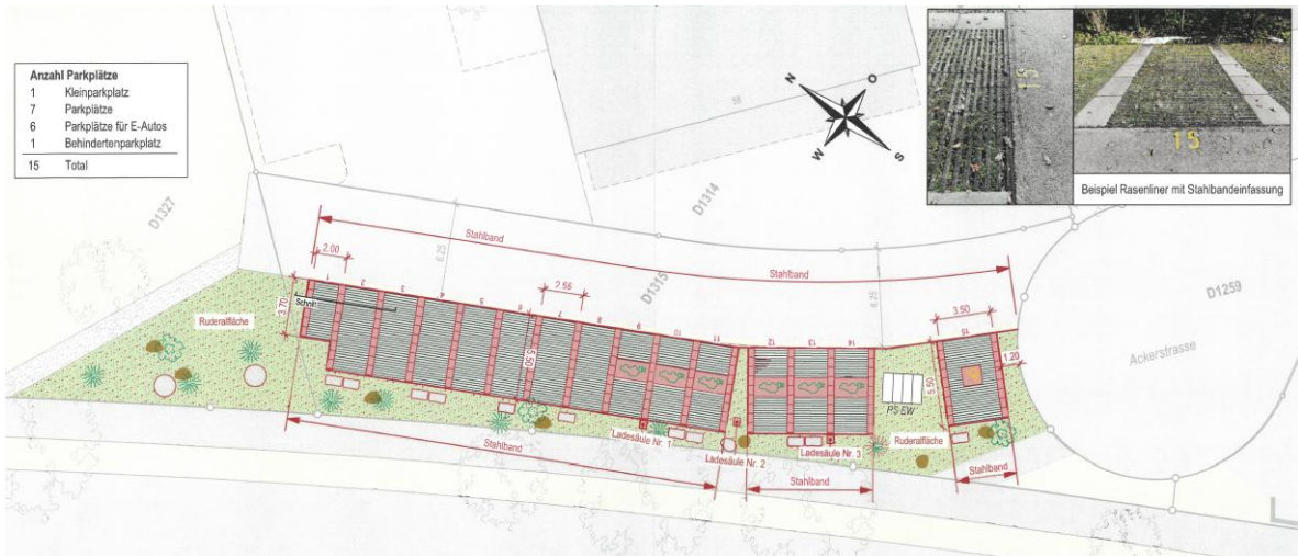
Projekt der Liegenschaftenverwaltung Uster für 14 Parkplätze, davon 7 mit Ladestationen