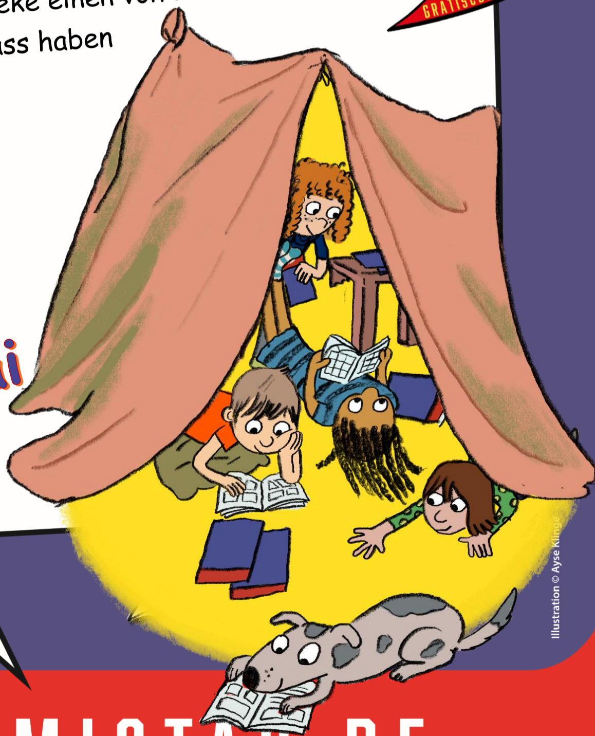
Illustration © Ayse Klinge