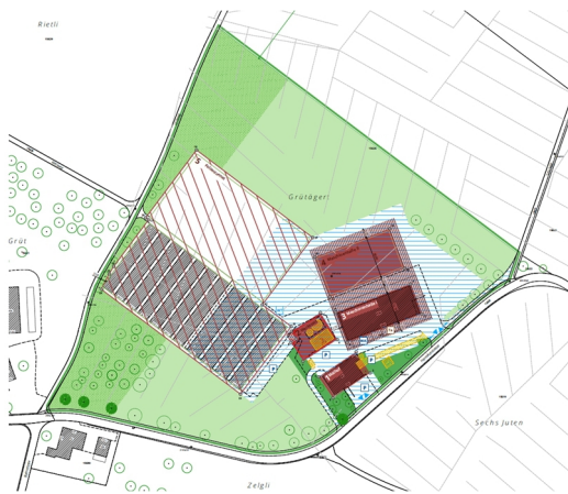
Abb. 1: Auszug privater Gestaltungsplan «Grütägert, Hermikon» (Stand für die öffentliche Auflage; SKW AG)

Sie haben die Zürcher Planungsgruppe Glattal mit Schreiben vom 17. November 2023 eingeladen, zum privaten Gestaltungsplan «Grütägert, Hermikon» im Rahmen der Anhörung Stellung zu nehmen. Der Vorstand der ZPG hat das Geschäft an der Sitzung vom 13. Dezember 2023 beraten.