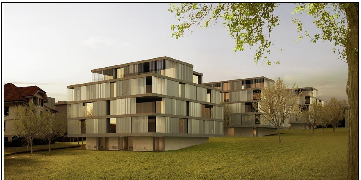
Illustration der geplanten Wohnüberbauung an der Casinostrasse

Die Evangelisch-reformierte Kirchgemeinde Dübendorf ist Eigentümerin von sechs Grundstücken an der Casinostrasse in Dübendorf (Kat-Nrn. 957, 958, 4197, 7034, 10992 und 15950). Auf diesen Grundstücken stehen derzeit zwei alte Pfarrhäuser und ein Schopf, die heute zum Teil fremdvermietet sind. Alle diese Grundstücke liegen in der Zone für öffentliche Bauten. Sie wurden 1986 – als Pfarrhäuser – im Umfeld anderer, dem Bund gehörenden Liegenschaften der Zone für öffentliche Bauten zugeteilt, werden künftig aber nicht mehr zur Erfüllung öffentlicher Aufgaben benötigt. Die Kirchgemeinde beabsichtigt, auf diesen Grundstücken eine Wohnüberbauung zu realisieren, mit alters- und behindertengerechten Mietwohnungen, einer Kinderbetreuungsstätte, einem Gemeinschaftsraum und ein bis zwei Pfarrwohnungen.