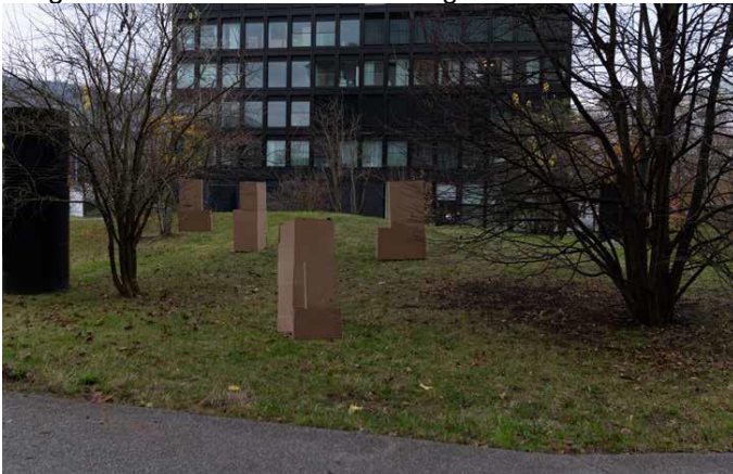
Abb.10: Gruppierte Setzung der Skulpturen - neue Ansicht vor dem Stadthaus

Vergleiche sämtliche Visualisierungen in der Überarbeitung in Beilage 2.