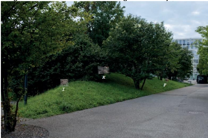
Abb. 8: Platzierung der drei «Stadthäuser» in der Umgebung; I: Isenthal, K: Kalesija, F: Fürstenfeld

Vergleiche sämtliche Visualisierungen des Projekts in Beilage 2.