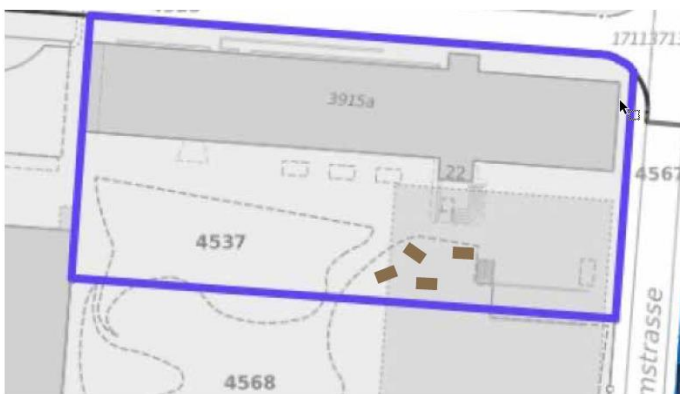
Abb. 11: Platzierung der Skulpturen im Perimeter