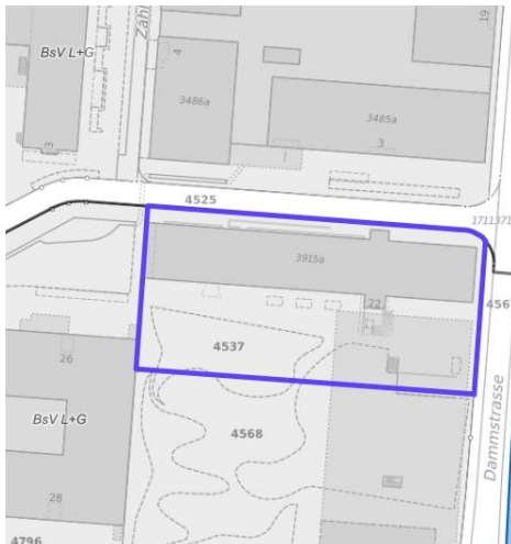
Abb. 1: Perimeter städtischer Grund vor dem Stadthaus Zug an der Gubelstrasse 22, 6301 Zug

Der Raum vor dem Stadthaus Zug an der Gubelstrasse 22, 6301 Zug, welcher durch den gekennzeichneten Perimeter (s. Abb. 1) angegeben ist, soll mit Kunst im öffentlichen Raum bespielt werden. Es soll eine künstlerische Arbeit entwickelt und umgesetzt werden, welche die Verbundenheit zu oben genannten Orten, mit denen die Stadt Zug eine partnerschaftliche oder freundschaftliche Beziehung pflegt, darstellt. Die Art der Umsetzung und das Material sind der kunstschaaffenden Person freigestellt. Für die Gestaltung stehen grundsätzlich alle künstlerischen Medien zur Verfügung. Voraussetzung ist die technische Realisierbarkeit. Eine Jury wählt anhand der eingereichten Dossiers eine kunstschaaffende Person aus. Die vorgeschlagene Idee darf die Funktionalität und Befahrbarkeit der Umgebung nicht beeinträchtigen bzw. einschränken (Zufahrt, Durchfahrt und Sicherheitsvorgaben, vgl. Punkt 4.3). Die Realisierung ist ab Januar 2025 geplant.