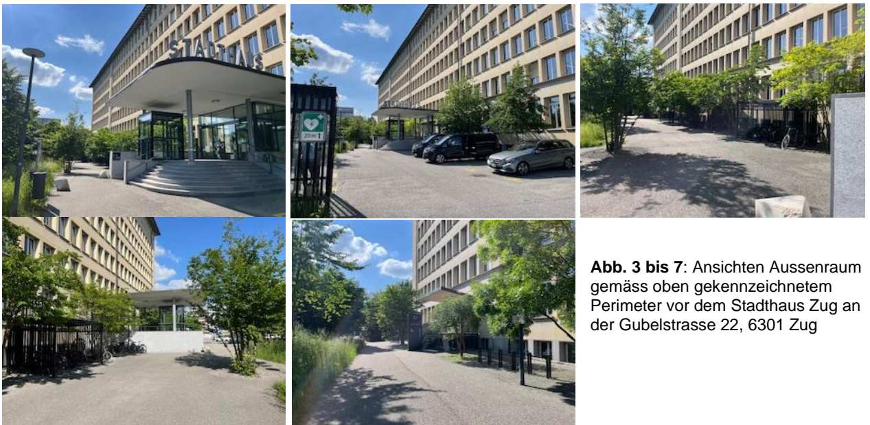
Abb. 3 bis 7: Ansichten Aussenraum gemäss oben gekennzeichnetem Perimeter vor dem Stadthaus Zug an der Gubelstrasse 22, 6301 Zug