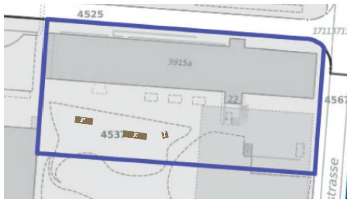
Abb.9: Platzierung der drei «Stadthäuser» im Perimeter