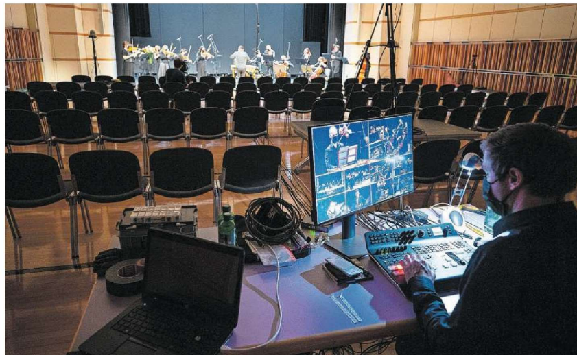
Die Liveübertragung aus dem zwangsläufig leeren Lorzensaal funktioniert einwandfrei.