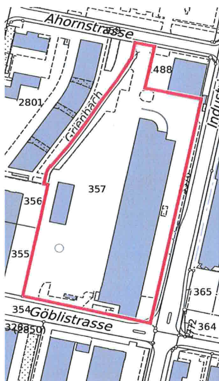
Heutiges Areal GS 357 Quelle: www.zugmap.ch