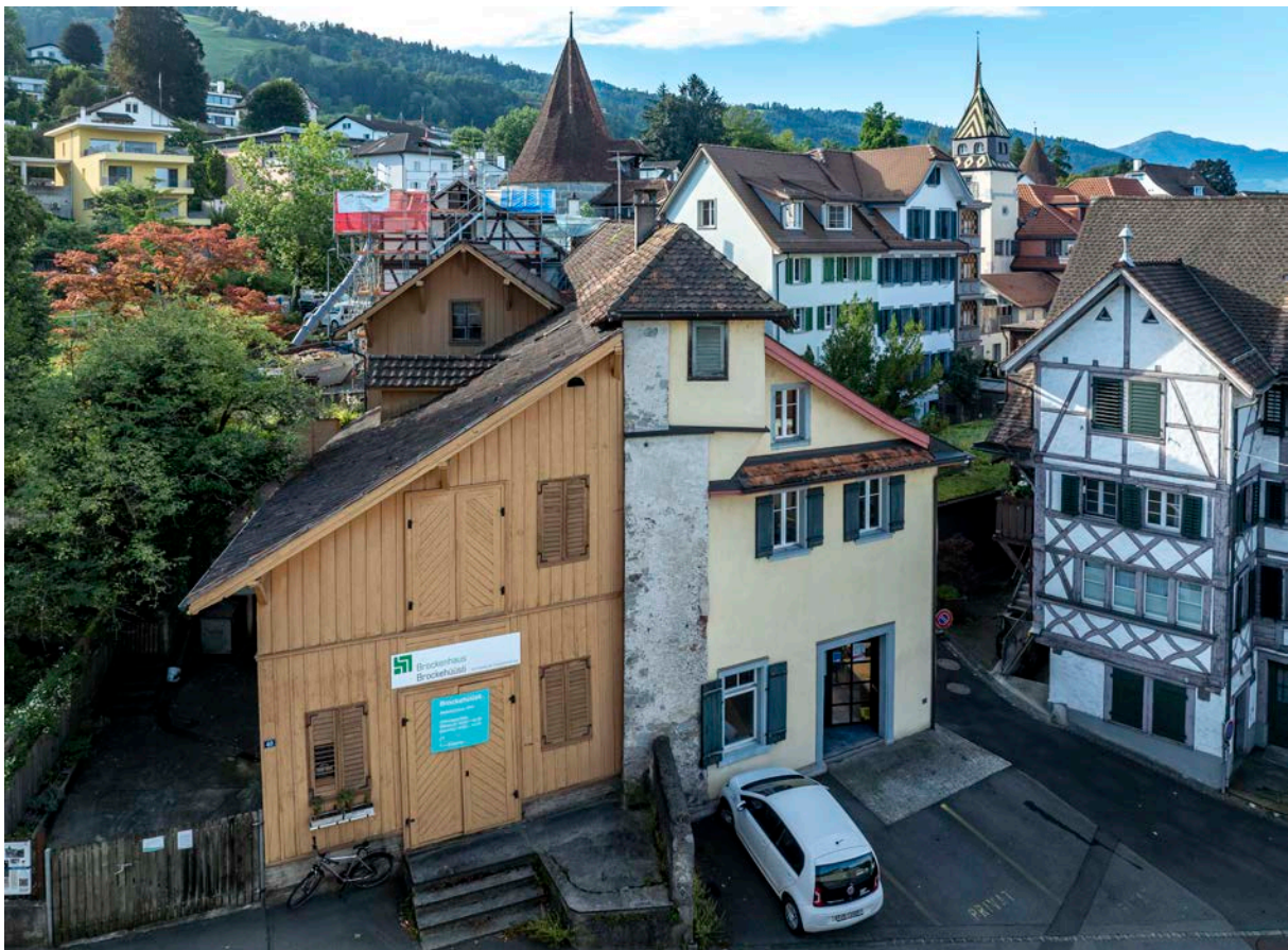
Das seitlich an der Stadtmauer angebaute «Kirsch-Depot» an der Aegeristrasse 40, errichtet 1884, 2024. (Zuger Kirschwasser-Gesellschaft © Ueli Kleeb)

05.03.26 © DNS-Transport, Zug/Caroline Lötcher & Ueli Kleeb