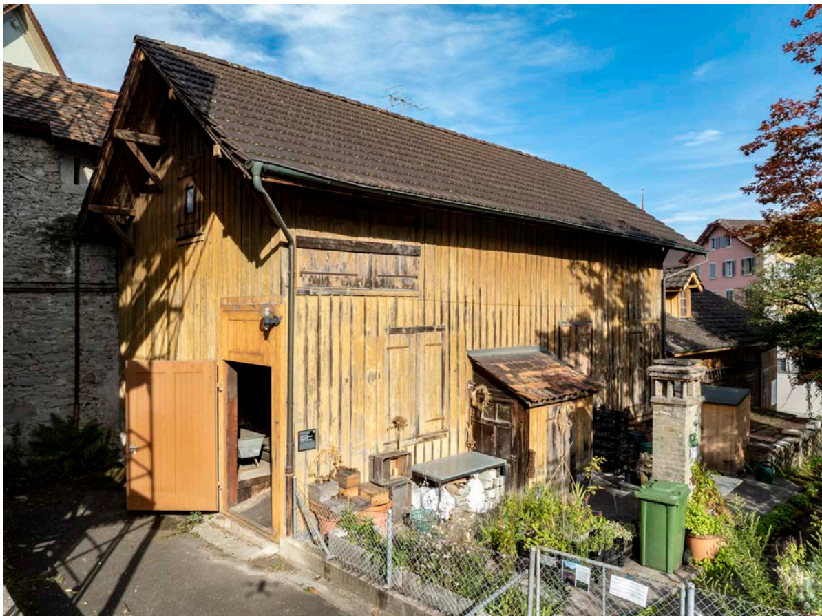
Eingang zum Schaulager, einer Sammlung mit mehreren hundert Kirsch-Exponaten und Brennereien, 2024.

Das geplante «Kirsch-Depot» steht für ein wichtiges Stück Zuger Kultur-, Kulinarik- und Wirtschaftsgeschichte und soll als kultureller und gesellschaftlicher Treffpunkt und lärmarmen Veranstaltungsort zur Belebung der Zuger Altstadt beitragen. Das geplante Kompetenzzentrum steht auch für die Wissensvermittlung rund um den «Kirschenanbau» im Kanton Zug, der neben dem «Flössen» auf dem Aegerisee und dem «Chrööpfelimee» in der Zuger Altstadt zu den «lebendigen Traditionen der Schweiz» zählt und vom Kanton Zug als Legislaturziel ermöglicht und unterstützt werden soll. Das Projekt dient ausserdem der schweizweiten touristischen Vermarktung der jahrhundertealten Chriesi- und Kirschwasser-Kultur und so der Imagepflege von Stadt und Kanton Zug. «Kirsch-Touren» durch die Stadt können über Zug Tourismus gebucht werden und finden in Zusammenarbeit mit dem Verein «Zuger Stadtführungen» statt. Der Trägerverein rechnet mit 3900 Besucherinnen und Besuchern jährlich.