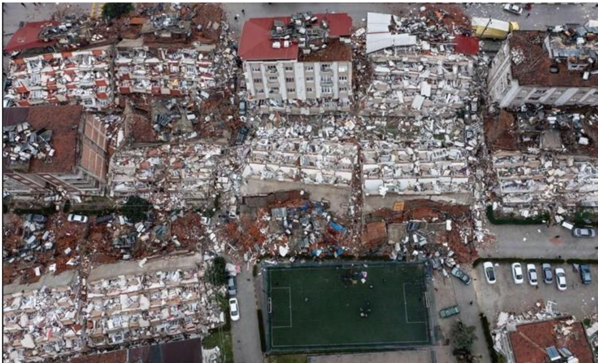
Das schwere Erdbeben hinterlässt eine Schneise der Verwüstung.

Wir setzen alles daran, die Opfer dieses tragischen Erdbebens mit der überlebenswichtigen Nothilfe und beim Wiederaufbau zu unterstützen. Helpen Sie uns, den Betroffenen in dieser schwierigen Zeit beiseitezustehen. Vielen Dank für Ihre wertvolle Solidarität.