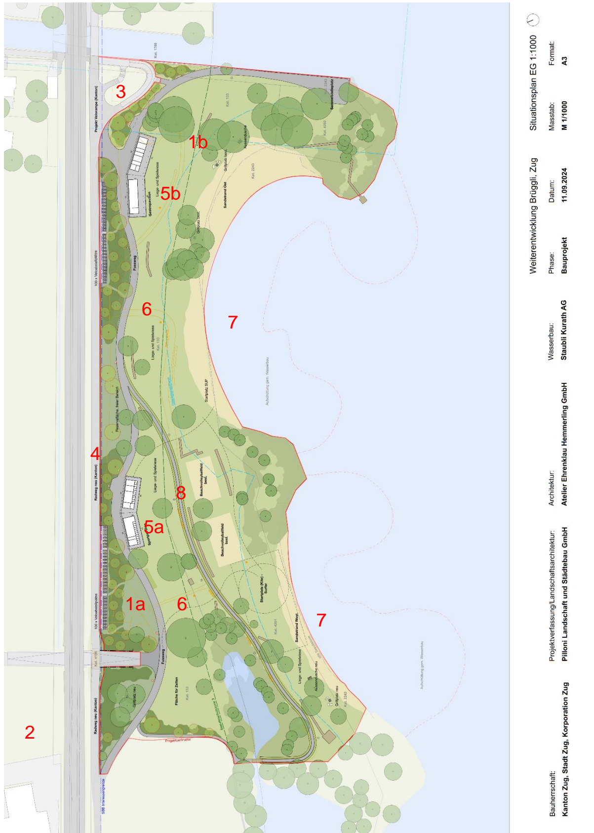
Abb. 3: Übersichtsplan Projekte

Legende: 1a ehemaliges TCS Gebäude (Abbruch), 1b öffentl. WC (Abbruch), 2 Ersatz Parkplatz, 3 (Velo-)Unterführung SBB, 4 Radweg, 5a Sportpavillon, 5b Gastronomiepavillon, 6 Landschaftsgestaltung, 7 Anpassungen Ufer, 8 Wanderweg