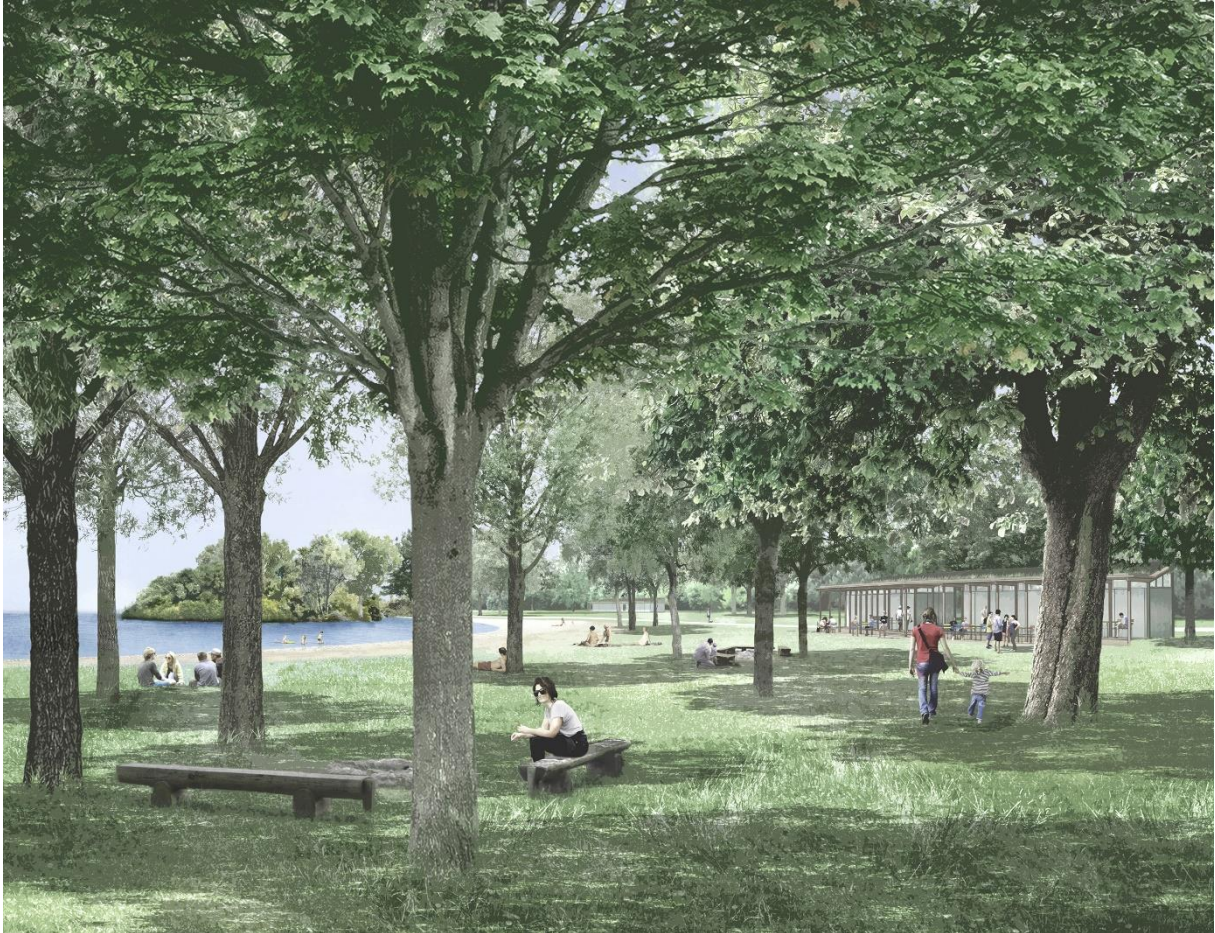
Abb.2: Visualisierung aus dem Studienauftrag (Stimmungsbild)