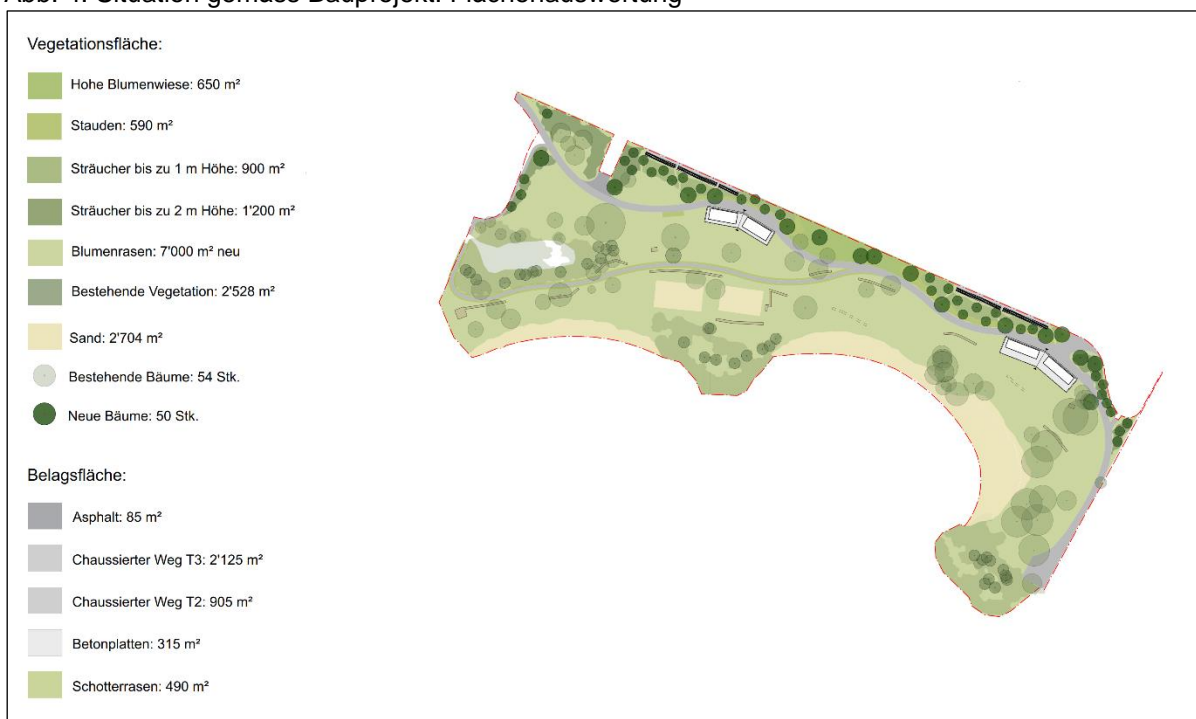
Abb. 4: Situation gemäss Bauprojekt: Flächenauswertung