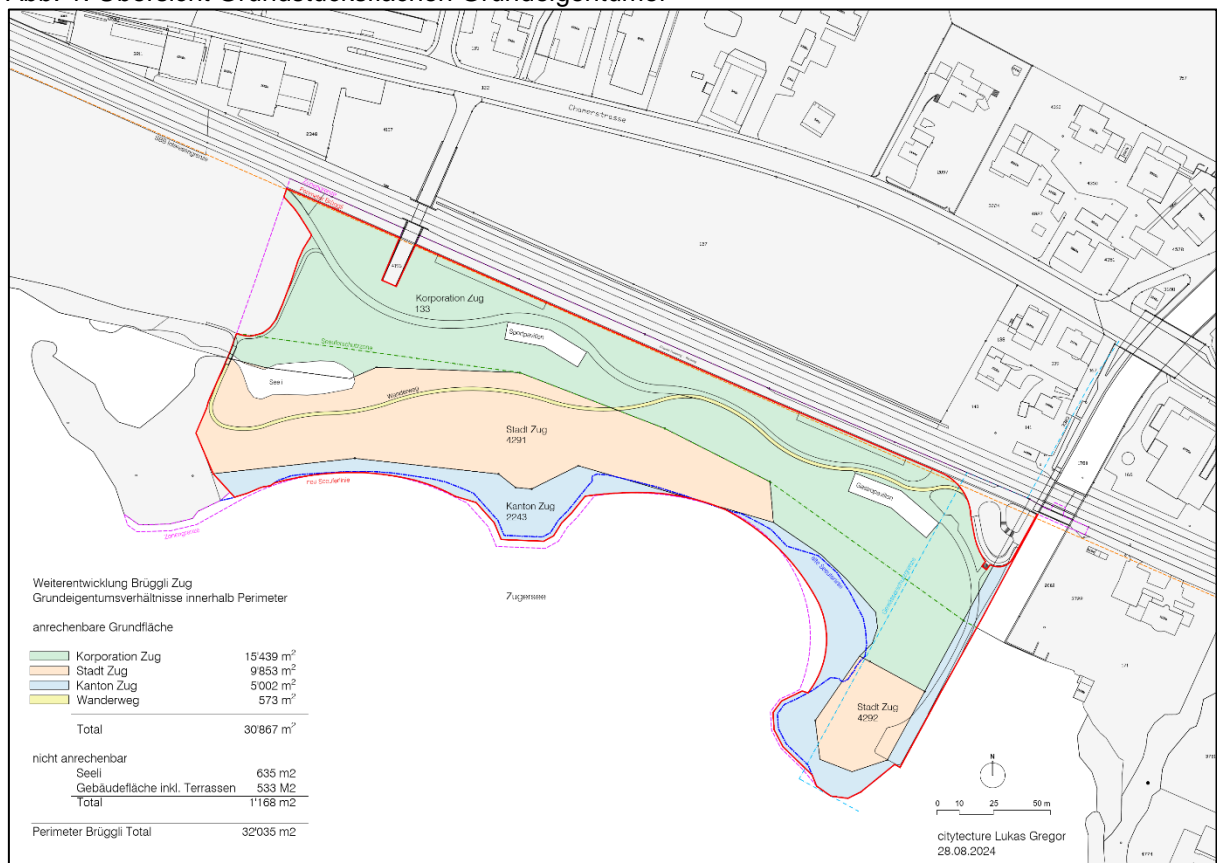
Abb. 1: Übersicht Grundstücksflächen Grundeigentümer