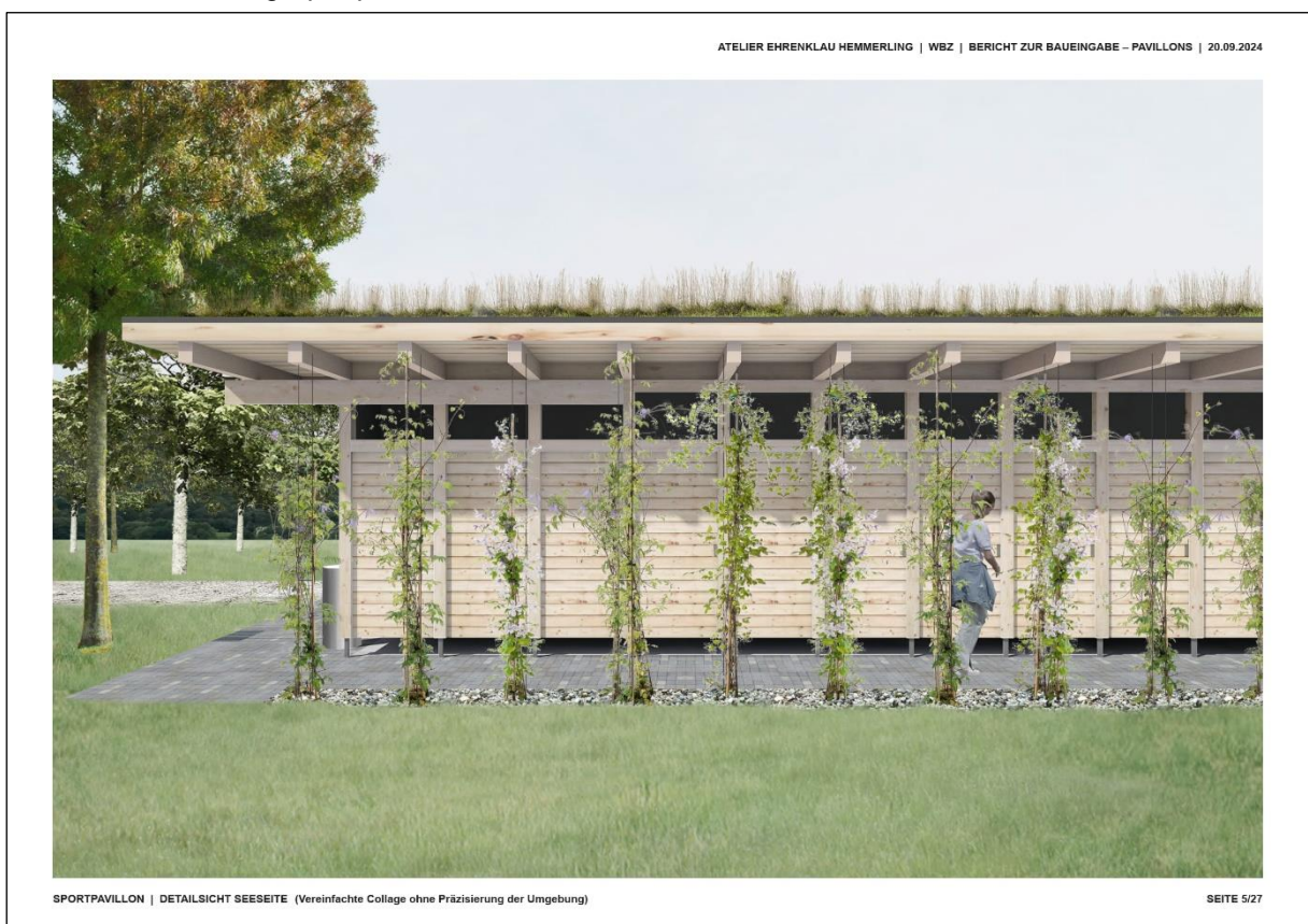
Abb. 5: Visualisierung Sportpavillon