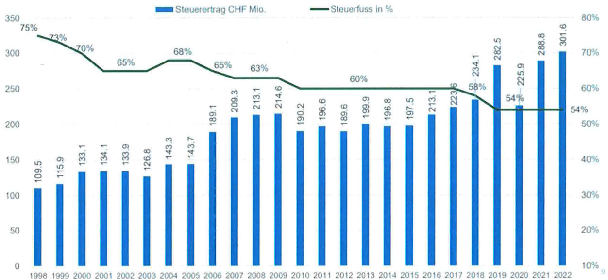
Graphik 1: Gegenläufige Entwicklung von Steuersatz und Steuerertrag in Zug über die letzten Jahre.