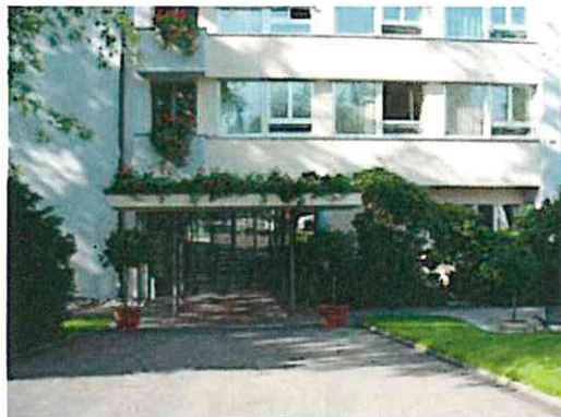
Alters- und Pflegeheim

für die Anpassung der mit der Überführung zusammenhängenden Finanzkompetenzen in der Gemeindeordnung gemäss Vorschlag des Stadtrats