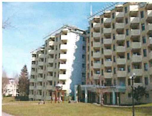
Alterssiedlung im Tal