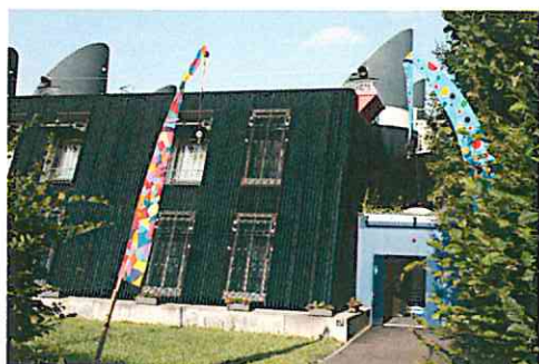
Pflegewohngruppe im Haus zum Mauersegler