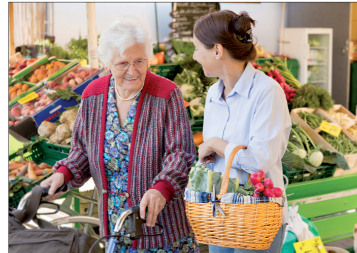
Nachbarschaftshilfe kann auch eine Unterstützung beim Einkaufen sein.