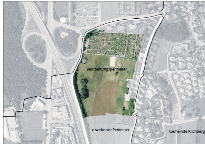
Das Gebiet Lätten liegt zwischen Adliswil, Zürich und Kilchberg an der Autobahn A3.

von vier Workshops mit einer Begleitkommission aus Mitgliedern der Stadt Adliswil, der Stadt Zürich, der Gemeinde Kilchberg, der Eigentümerschaft, einer Anrainervertretung sowie Fachleuten weiterer Disziplinen werden die Zwischenstände des Masterplans jeweils diskutiert. Als Schlussprodukt wird ein konkretes städtebauliches Zielbild unter Berücksichtigung der Aspekte Nutzung, Freiraum, Verkehr und Lärm resultieren. Das Ergebnis dient als Grundlage für den weiteren Planungsprozess.