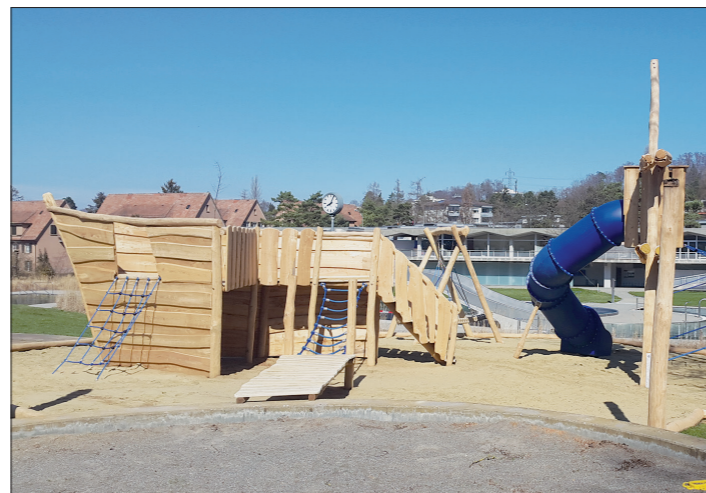
Das neue Piratenschiff im Freibad wird viele Kinder begeistern.

Das beliebte Freibad im Tal verfügt neben den Wasserflächen auch über eine Spielwiese, ein Beachvolleyballfeld, einen Sandkasten und einen Kinderspielplatz. Viele Gäste des Freibads sind Familien. Der bisherige Spielplatz und die Spielgeräte waren jedoch nicht für jedes Kinderalter geeignet, insbesondere nicht für Kleinkinder. In der Freibadsaison 2019 können sich die jungen Gäste nun auf einen neuen Spielplatz in Form eines Piratenschiffs freuen. Der Spielplatz verfügt über Kletterbereiche für unterschiedliche Ansprüche, zwei Rutschbahnen sowie eine grosse Schaukel. Übrigens: die Freibadsaison 2019 startet am 11. Mai 2019!