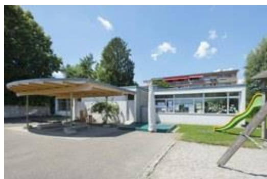
Bild 3: Kindergarten Goldbühl