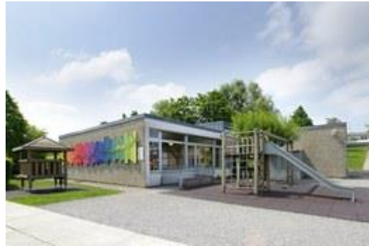
Bild 5: Kindergarten Egg

Innerhalb der baulichen Instandhaltungsstrategie der Abteilung Immobilien wurden die vier Doppelkindergärten vor über vier Jahren prioritär für eine grosszyklische Sanierung eingestuft. Insbesondere der Doppelkindergarten Goldbühl fällt durch seinen schlechten Gesamtzustand auf. 2017 wurde deshalb für diesen Kindergarten ein Sanierungskonzept der bestehenden Bausubstanz erstellt. Die vorgeschlagene grosszyklische Sanierung, ohne Eingriff in die bestehende Raumaufteilung, wies damals Kosten von rund 1,3 Mio. Franken aus. Dabei stellte sich heraus, dass eine energetische Verbesserung der Aussenhülle nur mit einer geringen Wirkung realisierbar wäre. Eine Zertifizierung mit dem tiefsten Minergie-Standard wäre nur mit unverhältnismässigem Aufwand erreichbar. Ausserdem wurde festgestellt, dass die Gebäudestatik keine künftige Aufstockung der Gebäude zulassen würde. Zudem könnten die vorhandenen räumlichen Defizite für den Betrieb nicht behoben werden.