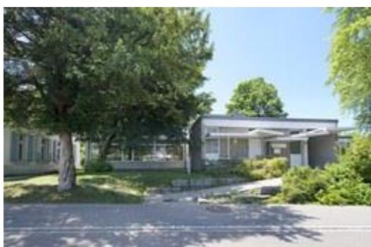
Bild 2: Kindergarten Kempten