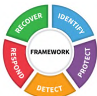
Abbildung 1: Cyber Security Framework NIST

Um diesen ganzheitlichen Ansatz zu verfolgen, hat der Stadtrat die Firma InfoGuard AG, eine der führenden Schweizer Firma für umfassende Cybersicherheit, mit der Erstanalyse beauftragt. Dieses Assessment erfolgte auf Basis des Cybersecurity Frameworks NIST, welches sich aus den folgenden Elementen zusammensetzt: