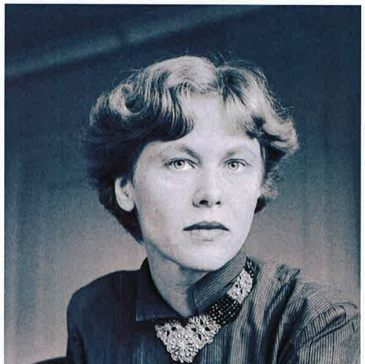
Iris von Roten (1917–1990) war eine Schweizer Juristin, Journalistin und Frauenrechtlerin. Frauen im Lauffgitter machte Iris von Roten über Nacht zur meistkritisierten Person der Schweiz ihrer Zeit. Das Buch löste einen Skandal aus. Als sie nicht mehr malen konnte, beschloss sie, Suizid zu begehen. Im September 1990 beendete sie ihr Leben.