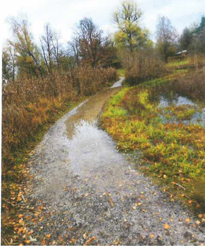
Zugangsweg vor dem Strandbad