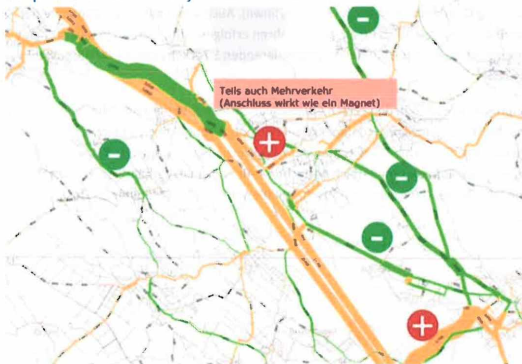
Abb. 2: Mehrbelastung auf den städtischen Achsen durch Autobahnanschluss Wetzikon

Aus diesen Gründen überprüft das ASTRA aktuell vertieft weitere Varianten der Oberlandautobahn ohne Anschluss Wetzikon (d.h. durchgehender Tunnel vom Autobahnanschluss Uster bis zum Kreisell Betzholz, was durch die wegfallende Autobahnstrecke im Aathal auch das Aathal massgeblich entlasten würde). Diese Variante "Tunnel tief lang" würde zu einer deutlichen Entlastung des Verkehrs auf den städtischen Achsen führen (vgl. Abb. 3). Sie würde somit dazu beitragen, Wetzikons