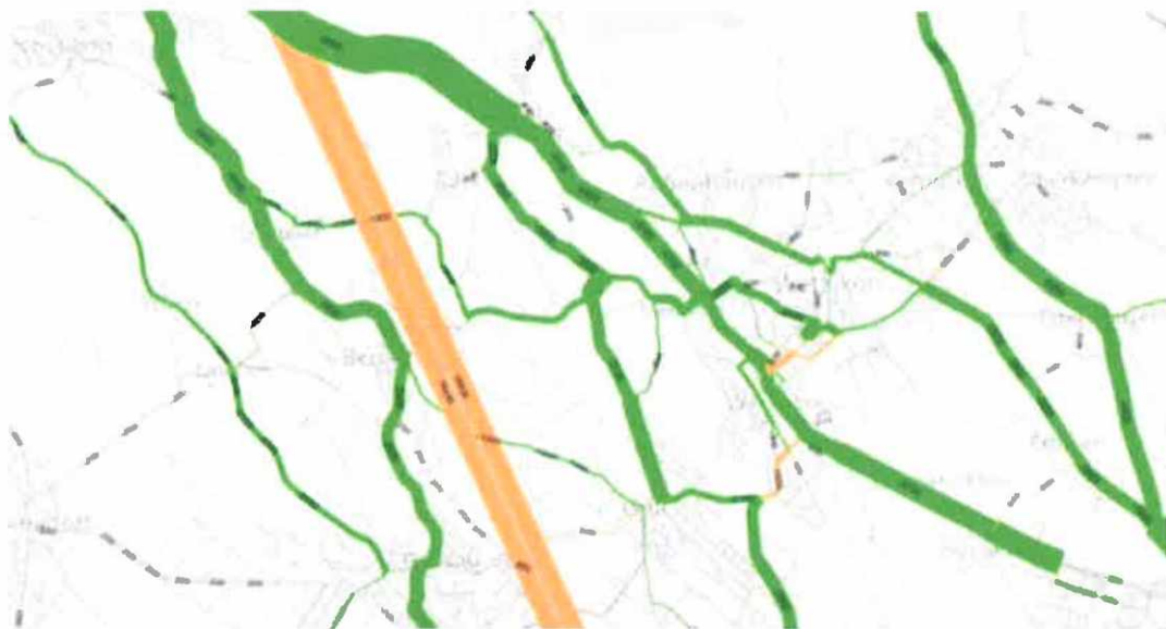
Abb. 3: Entlastung auf Verkehrsachsen in Wetzikon durch Verzicht auf Autobahnanschluss Wetzikon