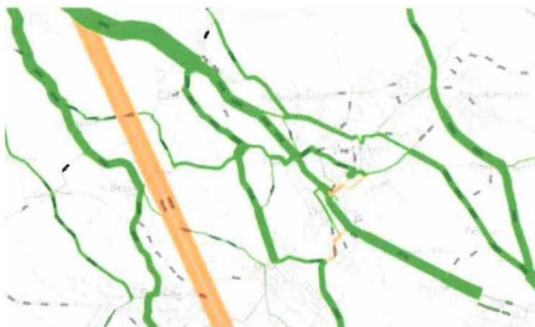
Abb. 3: Entlastung auf Verkehrsachsen in Wetzikon durch Verzicht auf Autobahnanschluss Wetzikon