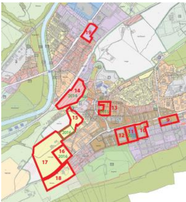
Abbildung 1: Auszug Plan Wohnbauentwicklung Littau, 14. Oktober 2013

Nebst der Überbauung Niedermatt Süd, bei welcher 2015 rund 146 Wohnungen bezogen werden können, sind weitere Areale für die Wohnbauentwicklung vorgesehen.