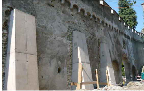
Stabilisierung Mauerabschnitt Museggstrasse

Mit der dritten und vierten Bauetappe 2009/2010 wurden die Mauerabschnitte Zytturm bis Schirmerturm, der Wachturm und der Mauerabschnitt Wachturm bis Zytturm ausgeführt.