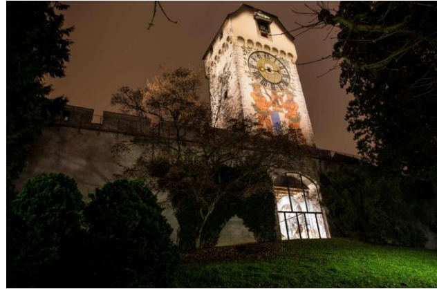
Der restaurierte Zytturm mit der Grossuhrenaussstellung