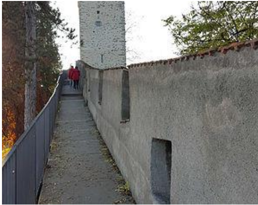
Der begehbarer Teil des Wehgangs