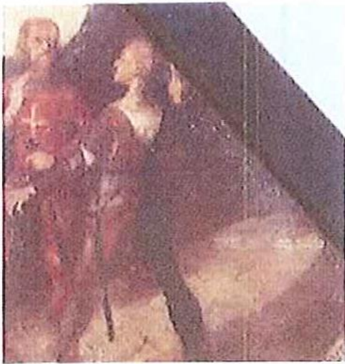
Bildausschnitt Originaltafel Schwur der drei Eidgenossen

Beispiele für willkürliche Oberflächentexturen und die freie Interpretation der originalen Bildvorlage in den Kopien