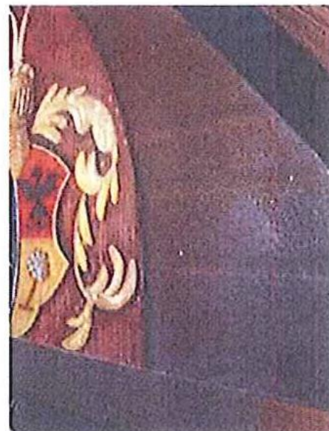
Kopientafel 31 Tellschuss