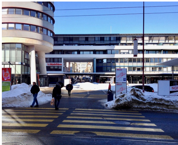
Abbildung 3: Bei Fussgängerstreifen und anderen Querungsstellen müssen die Schneewalme unterbrochen werden.

Aufgabe des Winterdienstes ist die Aufrechterhaltung der Verkehrssicherheit und der Leistungsfähigkeit der Strasse und Wege bei winterlichen Verhältnissen. Die Wirksamkeit des Winterdienstes hängt von allen Massnahmen ab, die der Verkehrssicherheit dienen und die Funktionen der Strasse und Wege so wenig wie nötig beeinträchtigen. Dazu gehören u. a. die rasche Beseitigung von Schnee und die rechtzeitige Bekämpfung der Eisglätte. (SN 640 750b, Grundnorm)