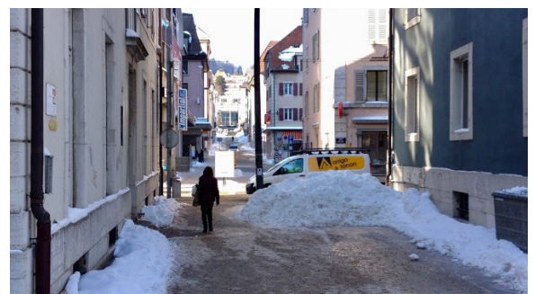
Abbildung 2: Schneedepots müssen gut geplant werden.

Die Haftung ist analog zu der Verantwortlichkeit geregelt. Werkeigentümer sind für den ordentlichen Unterhalt verantwortlich. Bei Unfällen wegen mangelndem Unterhalt haften sie bzw. die von ihnen beauftragten Verantwortlichen.