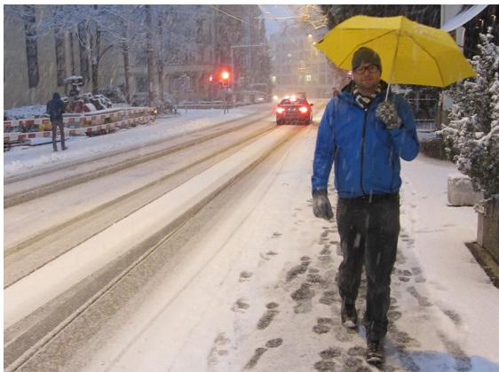
Abbildung 1: Die verschneite Stadt hat auch ihre angenehme Seite.

Das Gehen in verschneiten Städten hat einen besonderen Reiz. Die üblichen Verkehrsgeräusche sind nur gedämpft zu hören. Der Schnee auf Dächern und Bäumen verzaubert die Landschaft. Ein wirklicher Genuss ist dies nur, wenn die Trottoirs und Fusswege gut und sicher begehbar sind. Auf den kleinteiligen Fussverkehrsanlagen ist der Winterdienst aufwändig und teilweise mit erheblicher Handarbeit verbunden. Um Situationen zu vermeiden, wo die Strasse geräumt ist und das Trottoir im Tiefschnee versinkt, ist eine gute Vorbereitung und Organisation der Schneeräumung notwendig. Dass Fussgänger im Winter auf der Fahrbahn gehen (müssen), muss verhindert werden. Dies gilt insbesondere für Kinder auf dem Schulweg.